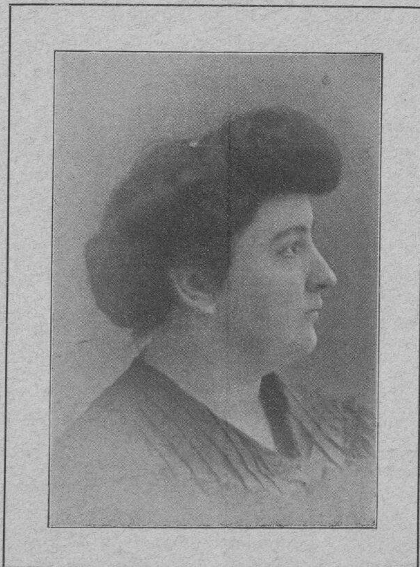
CARMEN DE BURGOS (COLOMBINE)