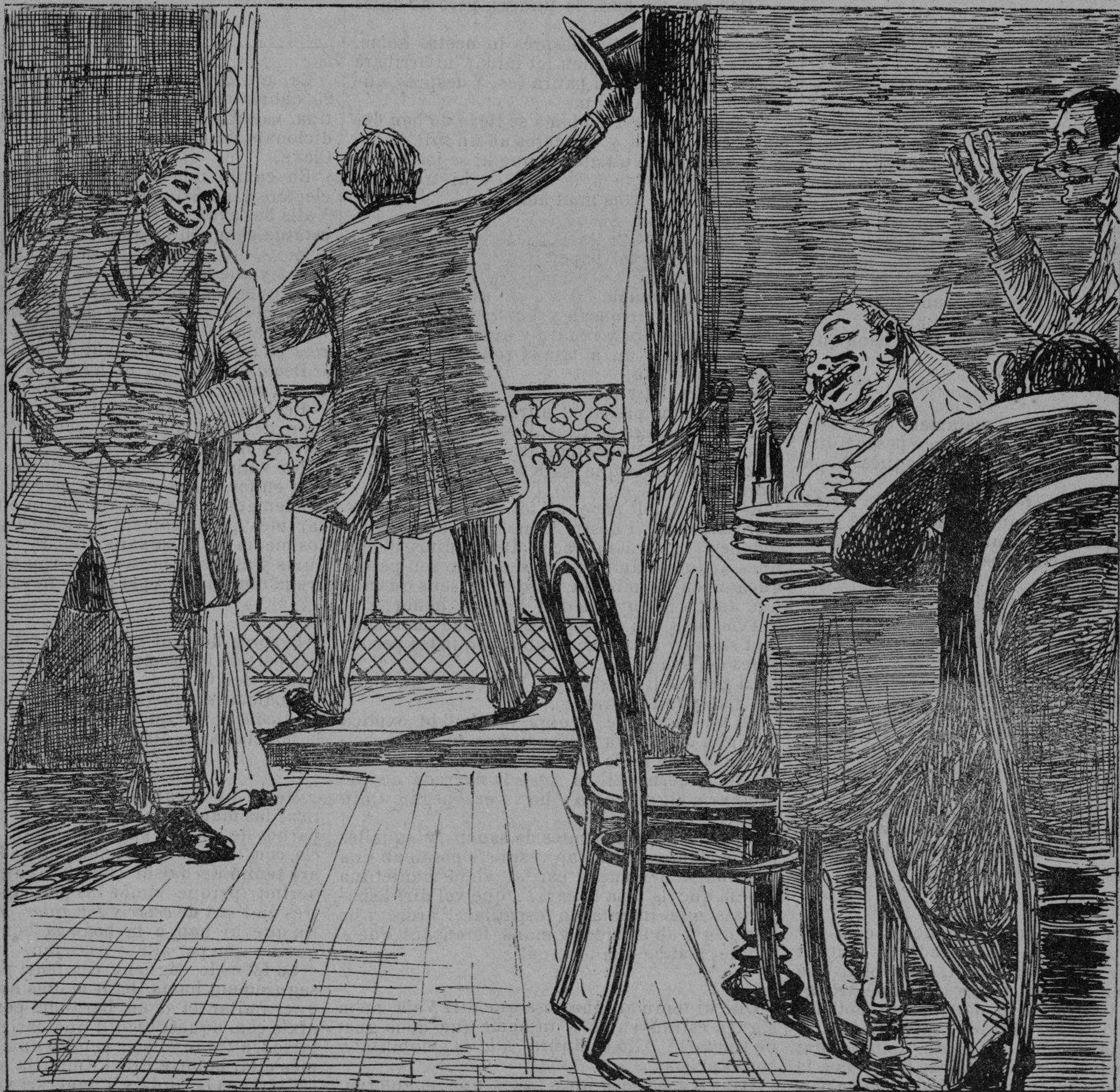
Amado pueblo soberano: la Pátria agradecida (Ap. la pancha contenta.) —Bravo! bravo!