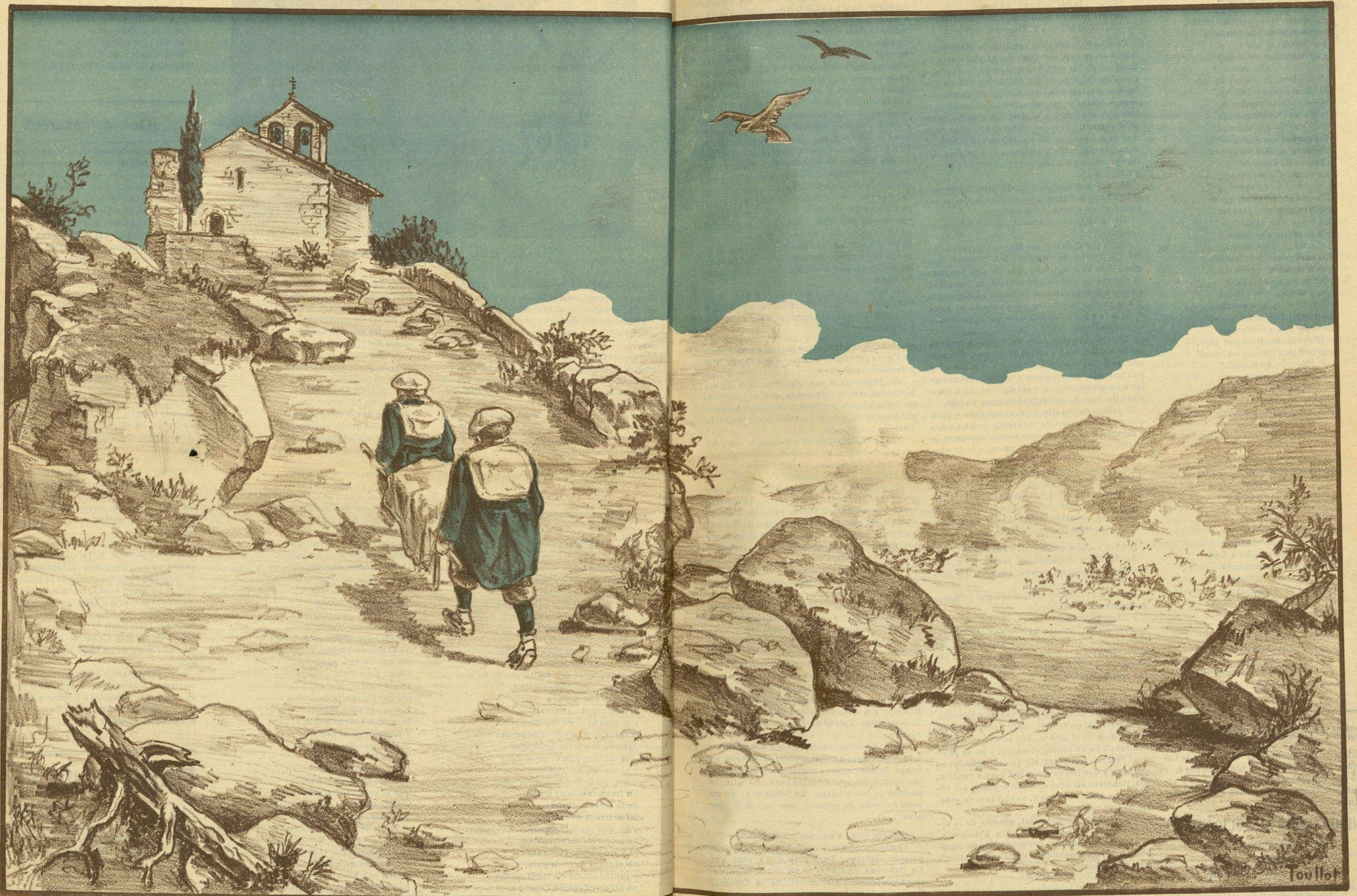
¡GLORIA Y HONOR ALS MOREN PER LA PATRIA!