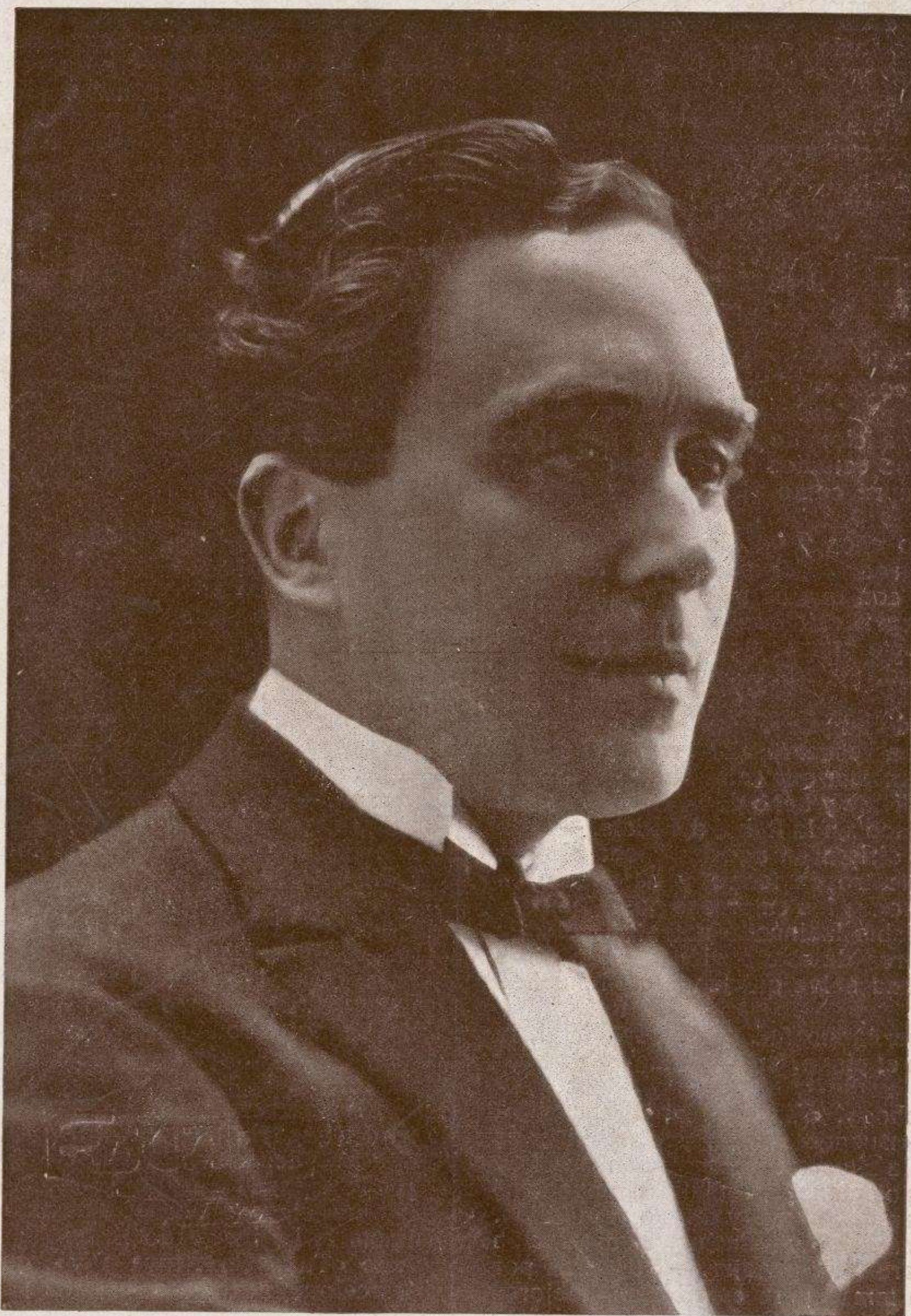
MANUEL JOVÉS Popularísimo compositor de tangos