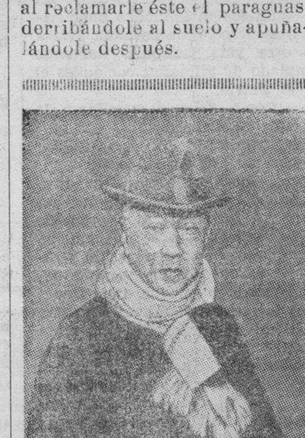
PRINCE SAIONJI Consejero del rey Hirohito que es al mismo tiempo uno de los hombres de más influencia del Japon

Este último abofetó a José al reclamarle éste el paraguas derribándole al suelo y apuñalándole después.