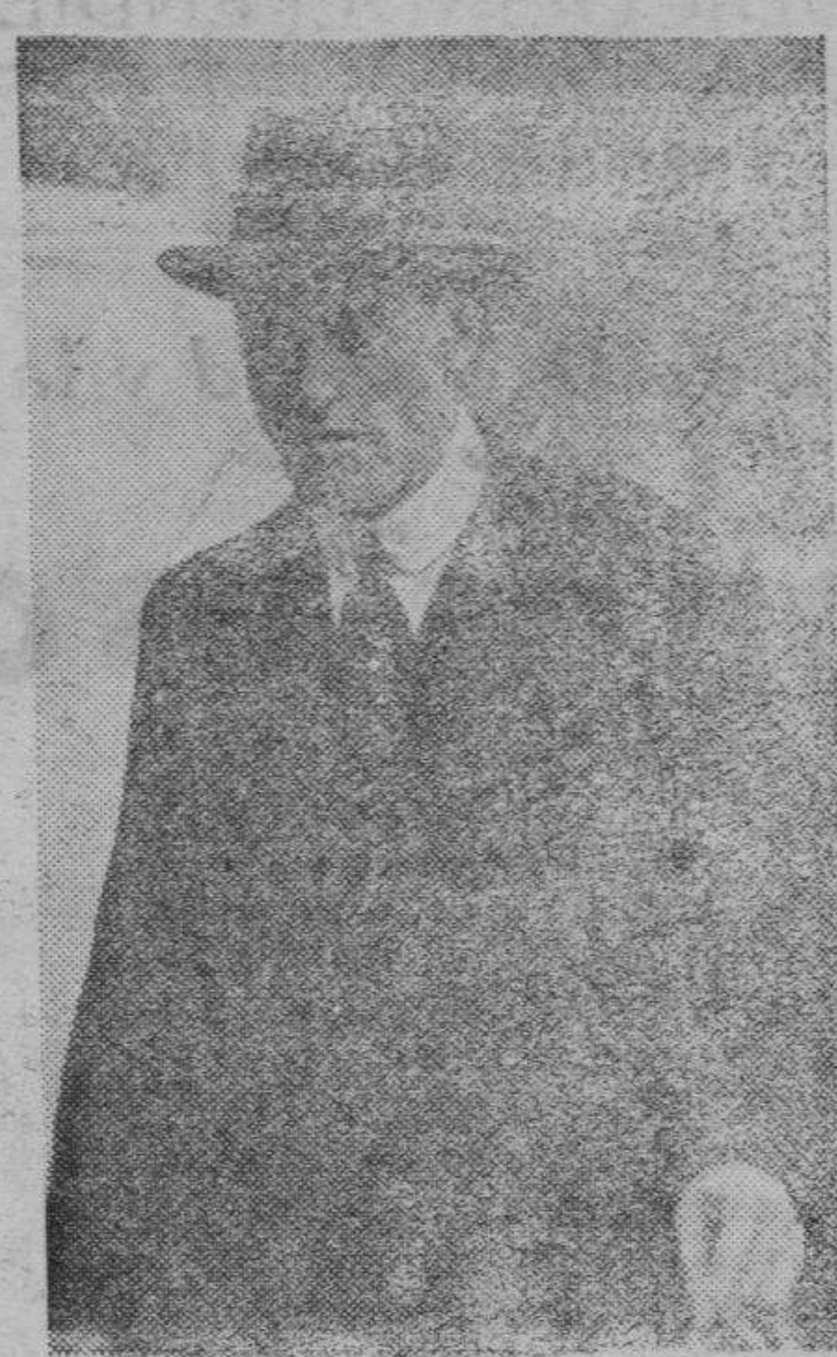
LORD SWINTON (Cunliffe Lister) el actual ministro del Aire de la Gran Bretaña que es nombrado en los círculos bien informados como futuro ministro de Hacienda de Inglaterra

Pero todo ha sido inútil, ya que se le contestaba a los informadores que el Gobierno de la Generalidad, es libre para hacer las