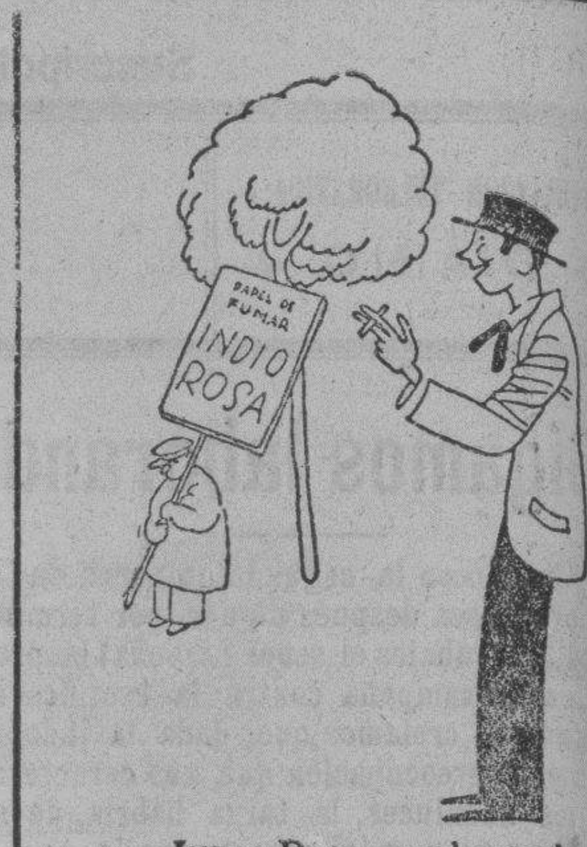
INDIO ROSA es el papel que goza de más cartel.

Diabetes, Neurastenia y Debilidades en general Aguas de Villaharta.—Peñas Blancas GRAN HOTEL «SANTA ELISA» Clima de alturas 650 m./en lo más pintoresco de la sierra de Córdoba. Temporadas oficiales: 15 de Abril a 15 de Junio.—1 de Septiembre a 31 de Octubre Pídanse folletos e informes al Administrador. Apartado de Peñas Blancas — Estación de Alhondiguilla (Córdoba)