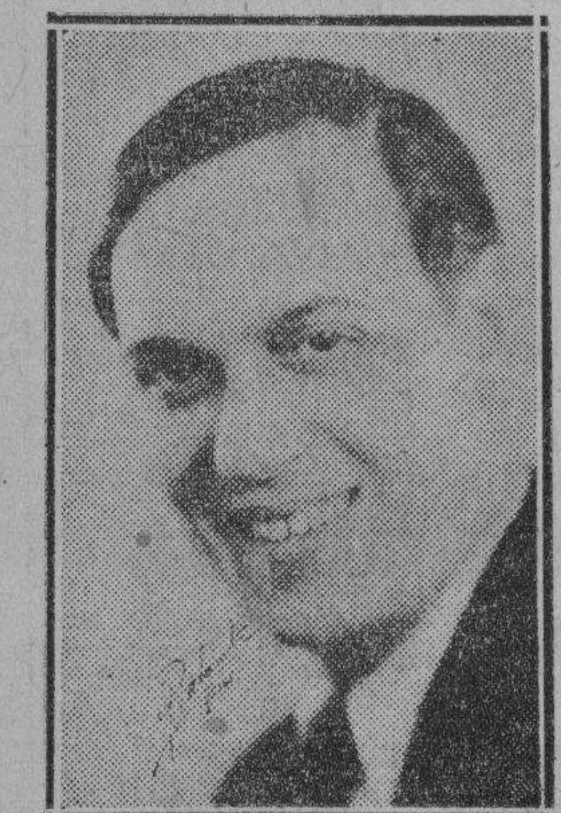
Ernesto Lecuona, nuestro aplaudido compositor y pianista, que actuará hoy en el teatro «Prado» con un brillante conjunto de artistas.

Hoy en el teatro «Prado» y en las tandas principales hará Ernesto Lecuona una especie de resumen de su breve temporada de arte cubano, brillantemente desarrollado en ese coliseo.