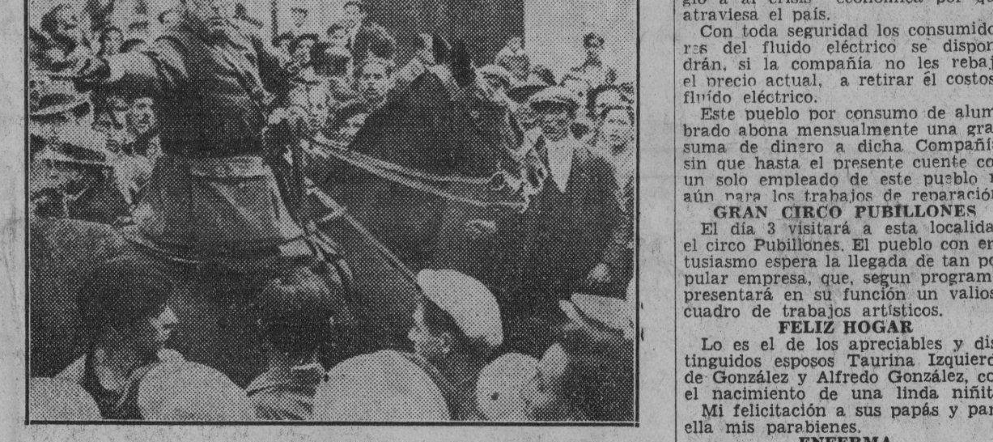
El nuevo Gobierno de España tuvo que declarar la ley marcial para calmar los ánimos anti-religiosos. Aquí se ve a un coronel persuadiendo a la turba a calmarse.