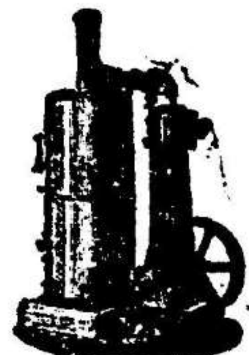
Máquina de vapor vertical.