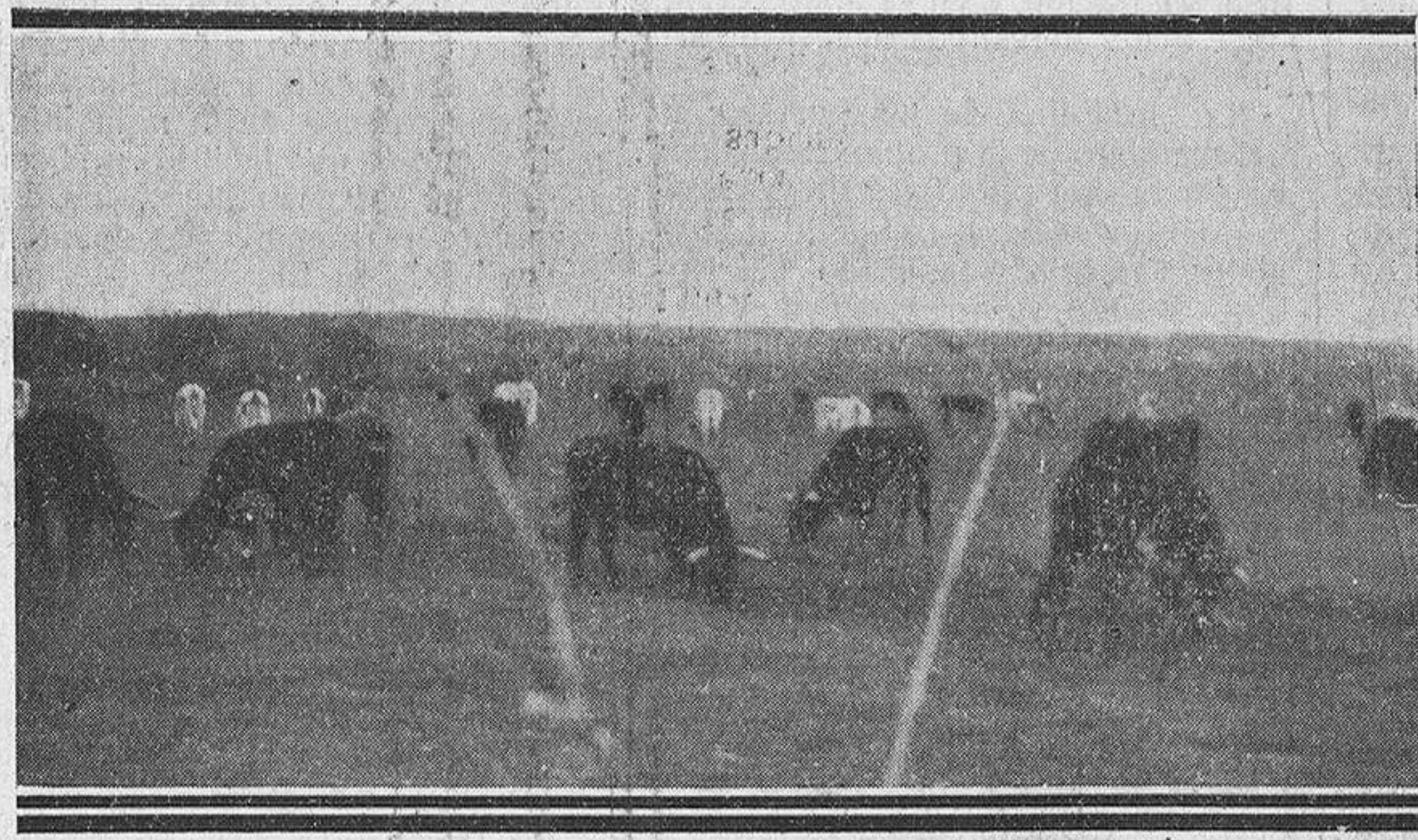
Estos que esperan comiendo, son los de Madrid, Pamplona, Salamanca, pero... unos meses antes de lidiarse

lance y la democracia, las que les hacen ser grandes señores. Desde el comedor mismo, en los momentos de la alimentación "intensiva", o en los que se saborea el exquisito moka y se mezcla con el aire el humo de los ricos "habanos", nuestros ojos van siguiendo la ruta de las nubes de polvo que caminan