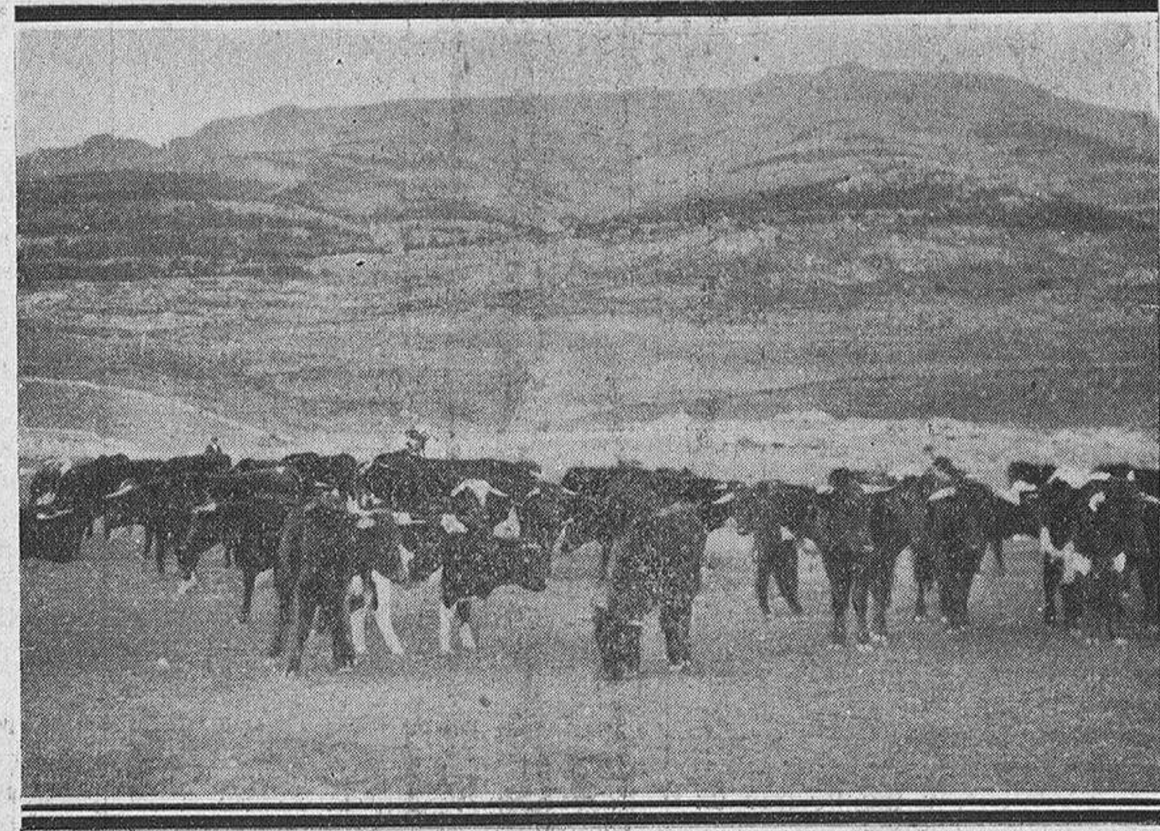
Esperando nuestra visita de inspección

A los pocos kilómetros, y tras corta espera, podemos impresionar una de las fotografías que ilustran el artículo. Los toros atraviesan la carretera de "El Escorial a Guadarrama".