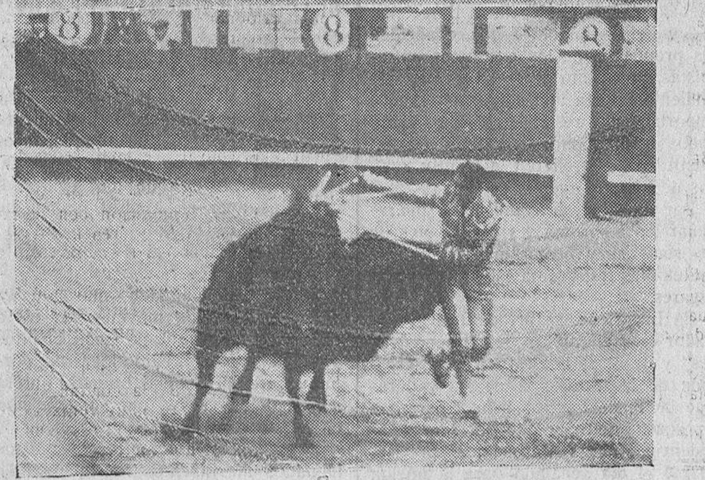
Arriba: Chicuelo, en el cuarto. En el centro: Pepe Bienvenida, en el quinto. Abajo: Chiquito de la Audiencia, en el tercero