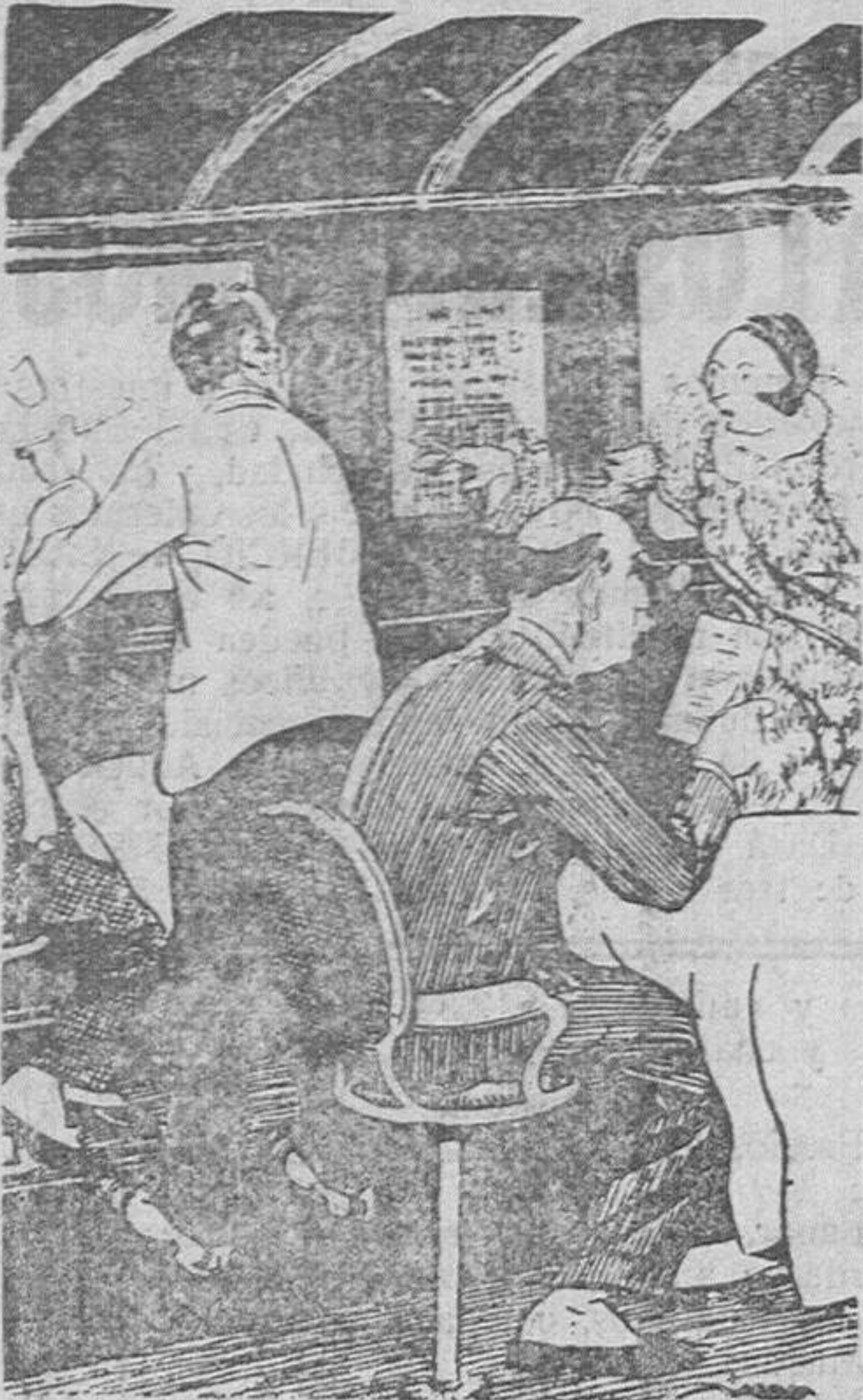
UNA DAMA (muy nerviosa).—Acaba de caerse un pobre hombre... ¡Vamos, pronto, échense ustedes un para-caídas!...

EL ADELANTO de hoy consta de DIEZ páginas.