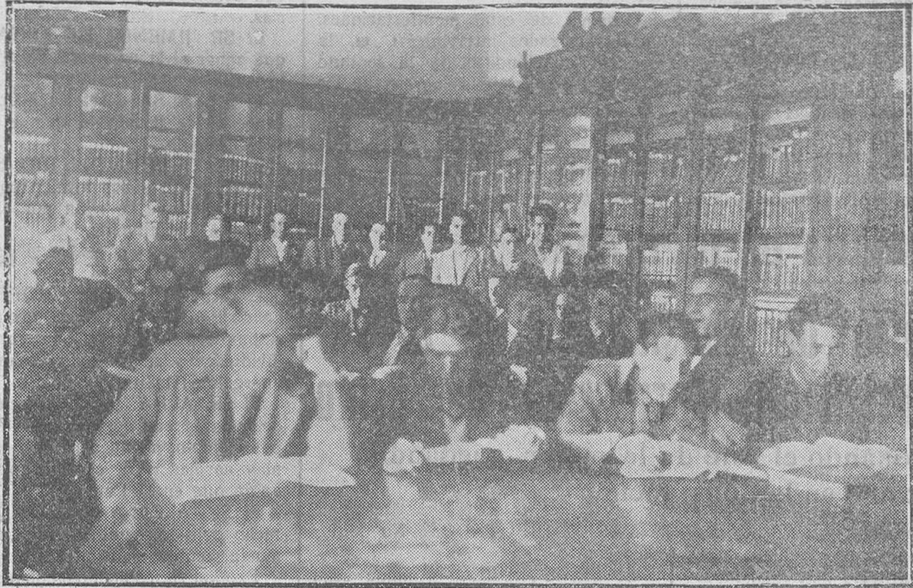
La biblioteca de la Facultad de Medicina, antes desolada y solitaria, es hoy, a diario, el confortable y voluntarioso laboratorio de estudio de aquellos estudiantes revolucionarios de ayer...

plaza de Anaya fué invadida de estudiantes y de curiosos. Tranquilamente se acercaron a la Facultad. Sobre las espaldas y los hombros de unos se alzaron otros para ganar la ventana. Rompieron los cristales, y con todo "orden", uno a