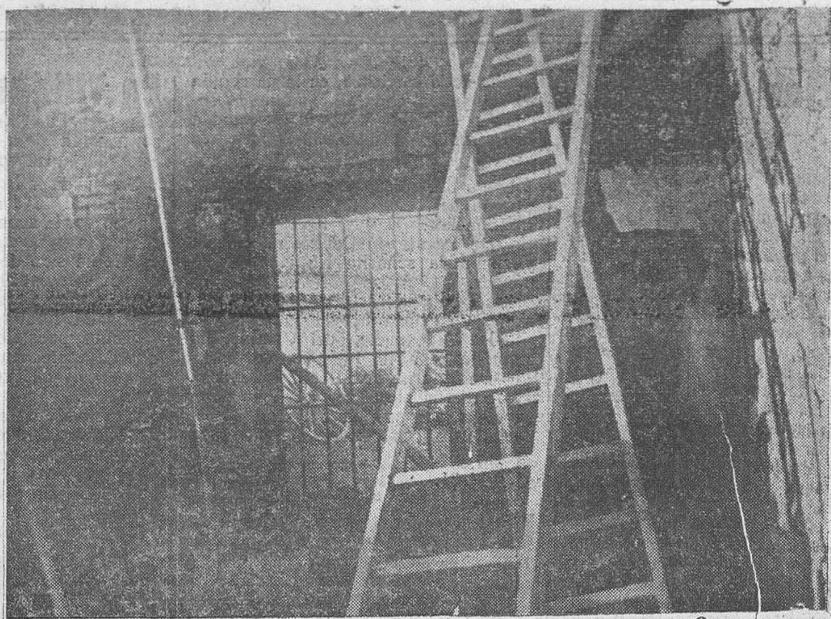
Un aspecto del obrador de la Fábrica, a poco del incendio