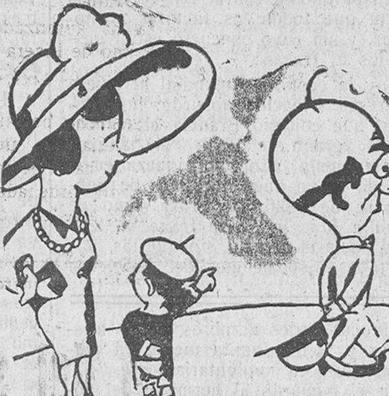
—Y ese señor, oye mamá, ¿es un nudista? —Sí; pero "amateur".

Diciembre, 4.—"El laicismo como ideal pedagógico. La escuela laica en las naciones cultas. El laicismo desde el punto de vista tradicional y espa-