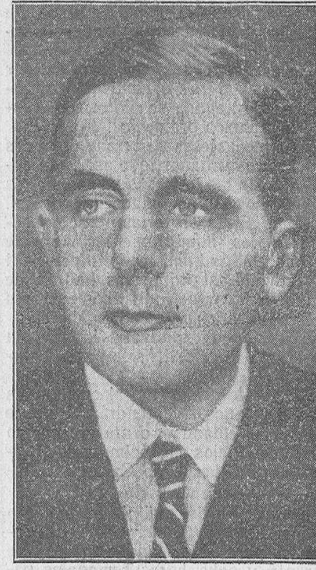
El director del Instituto del Kaiser Wilhelm, de Berlín, Otto H. Warburg, a quien le ha sido adjudicado este año el premio Nobel de Fisiología y Medicina general