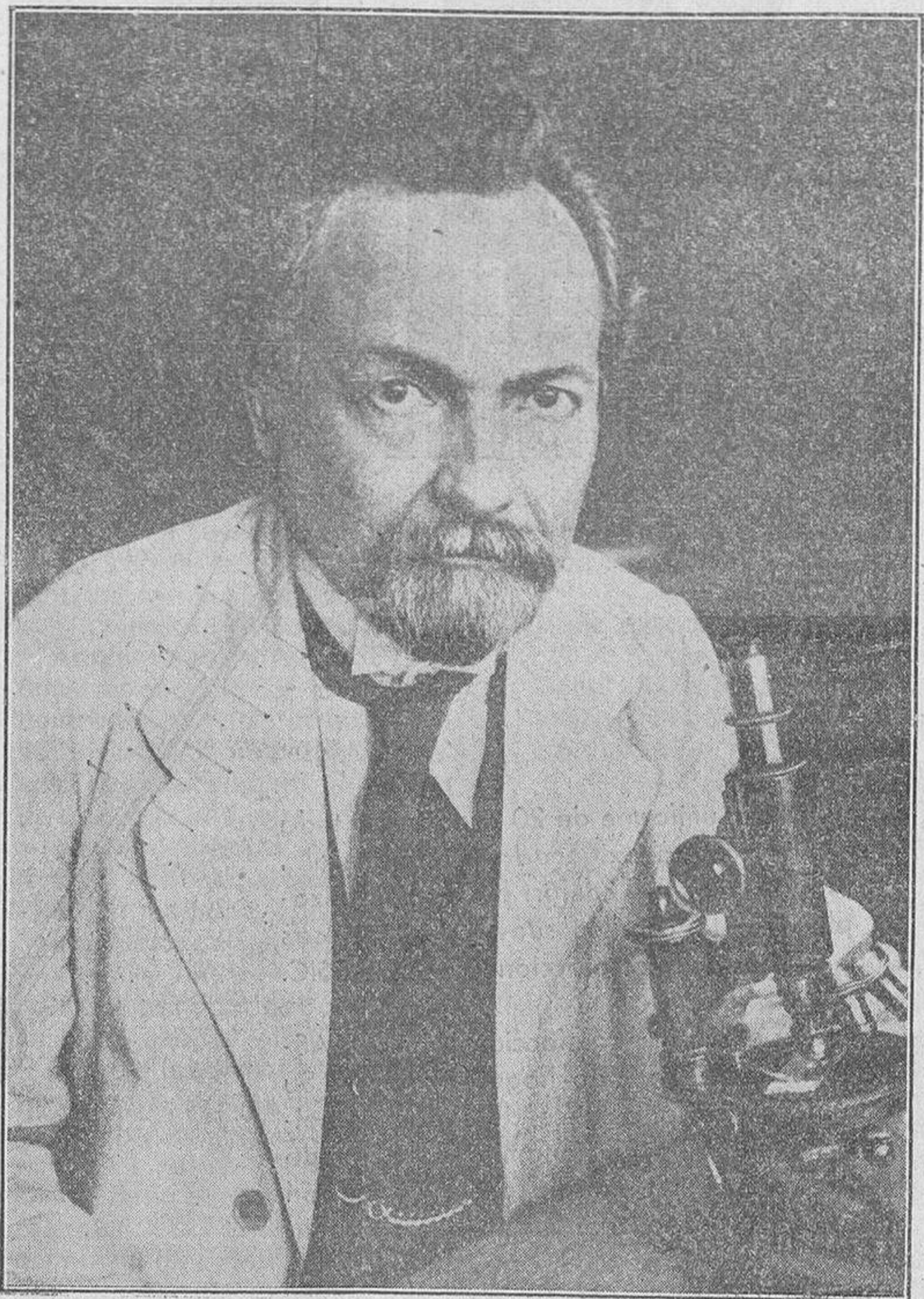
El sabio doctor Gunther Enderlein, de Berlín, cuyas comunicaciones sobre la curación de la tuberculosis han causado gran sensación en el mundo médico