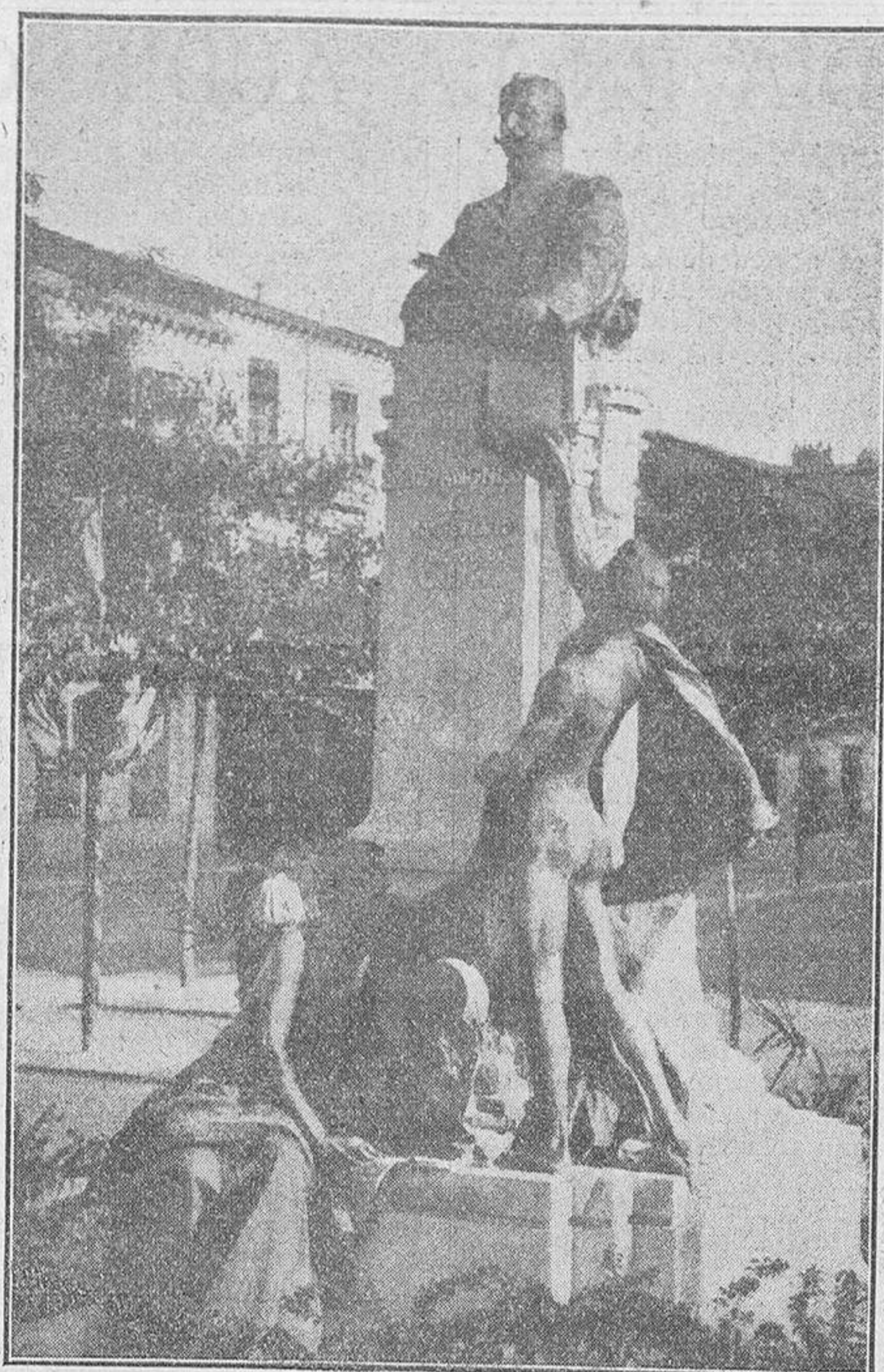
La estatua del Conde de Romanones, que se está desmontando de una plaza pública de Guadalajara, para ser colocada en el patio de la Escuela Normal de Maestros, de dicha población