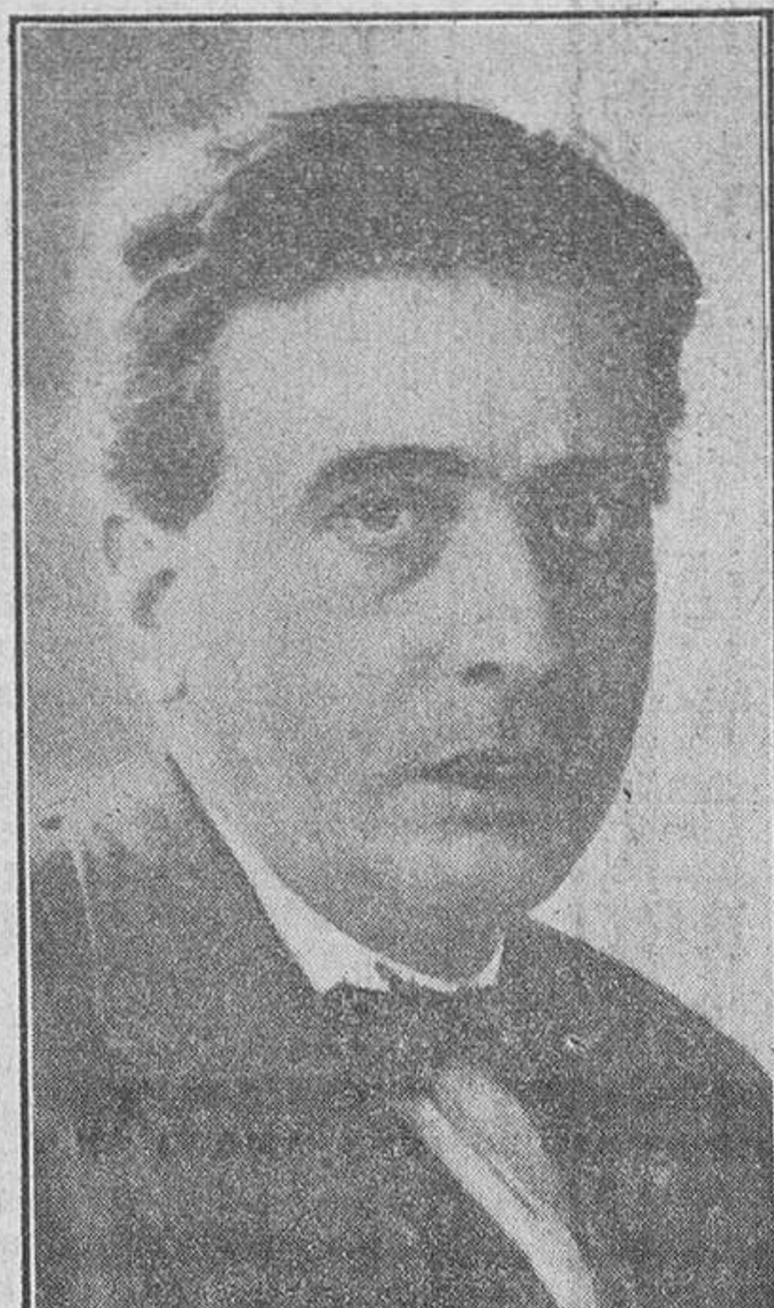
El distinguido escultor don José Cepuz, al que se ha concedido la Medalla de Oro del Círculo de Bellas Artes, con motivo de la Exposición de Pintura y Escultura que dicho centro celebra en el Retiro