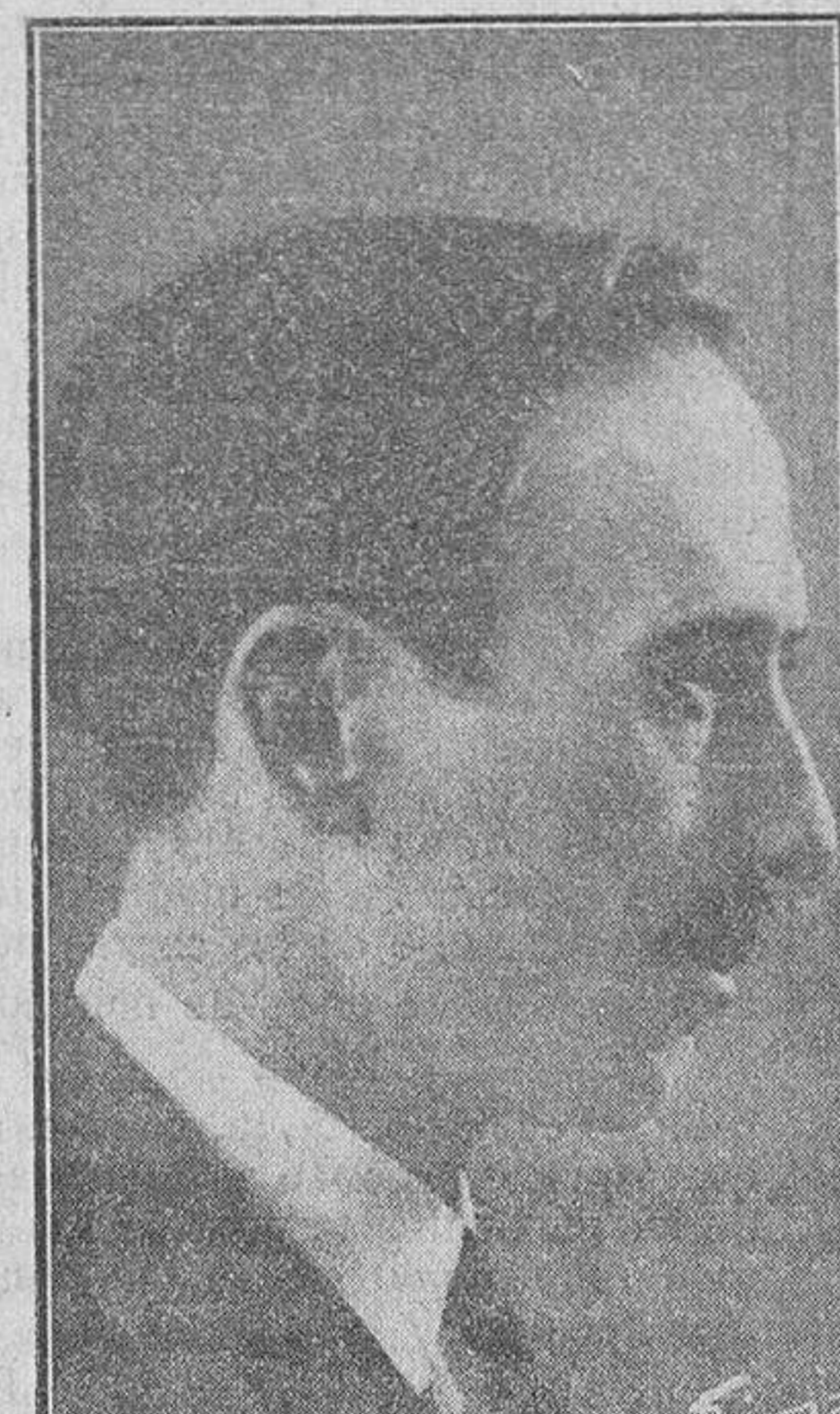
Don Juan Cristóbal, famoso y distinguido escultor, al que, con motivo de la Exposición de Bellas Artes, se le ha concedido el premio de 10.000 pesetas, dedicado a la escultura.