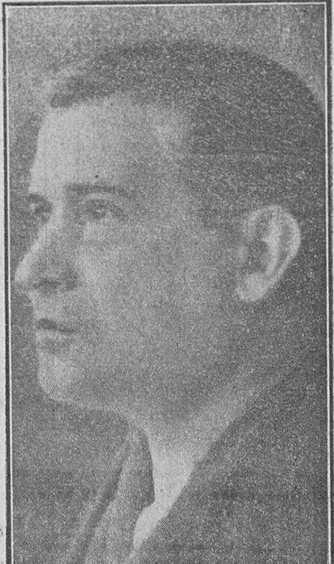
El ilustre pintor don José Gutiérrez Solana, que ha obtenido un premio de 100.000 pesetas en la Exposición de Bellas Artes, que se celebra en el Retiro, premio dedicado a la pintura.