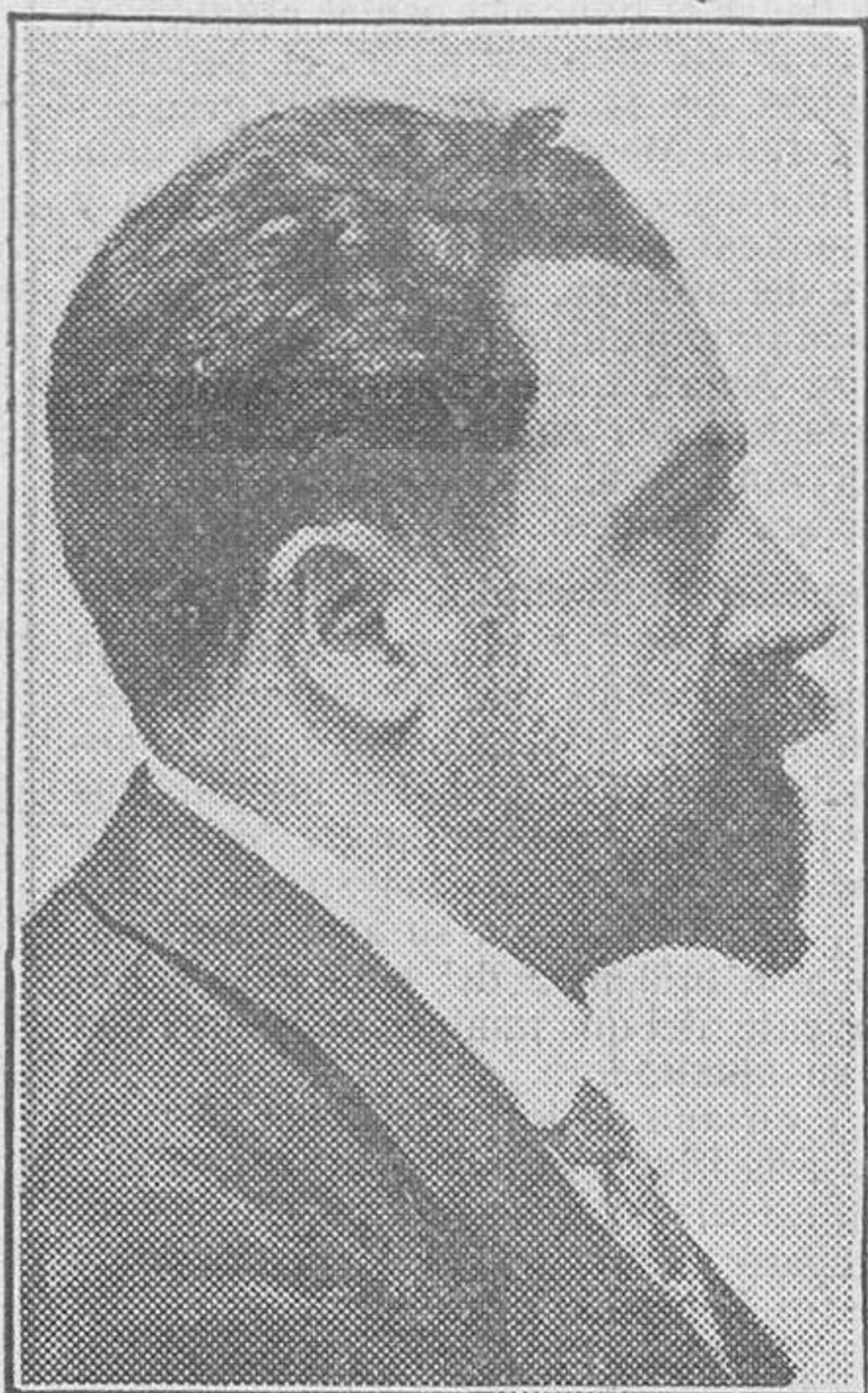
El ex ministro don Santiago Alba, que regresa de París a Madrid después de siete años y medio de exatriación, y cuyas declaraciones políticas están siendo tan comentadas.