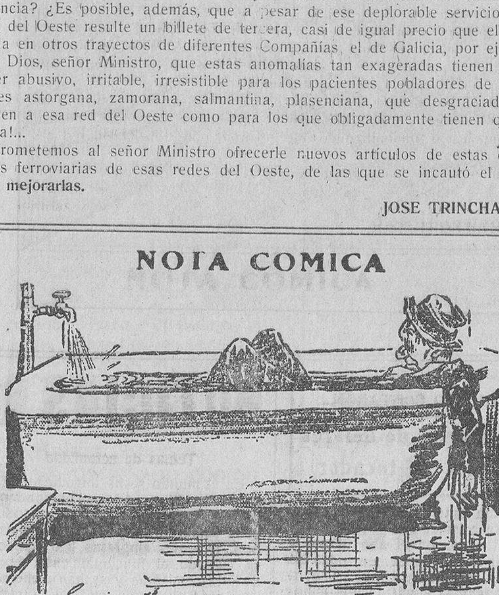
El beodo.—Tendré que regañarle a mi mujer, por haberme puesto las sábanas húmedas...

perfección los bailables de las más famosas bandas y orquestas del mundo, al ser reproducidas por el aparato con la mayor y extraordinaria sonoridad. Una felicitación más para la Casa Díaz, representante en Salamanca de magníficos amplificadores, que han dejado bien puesto el pabellón de su fama.