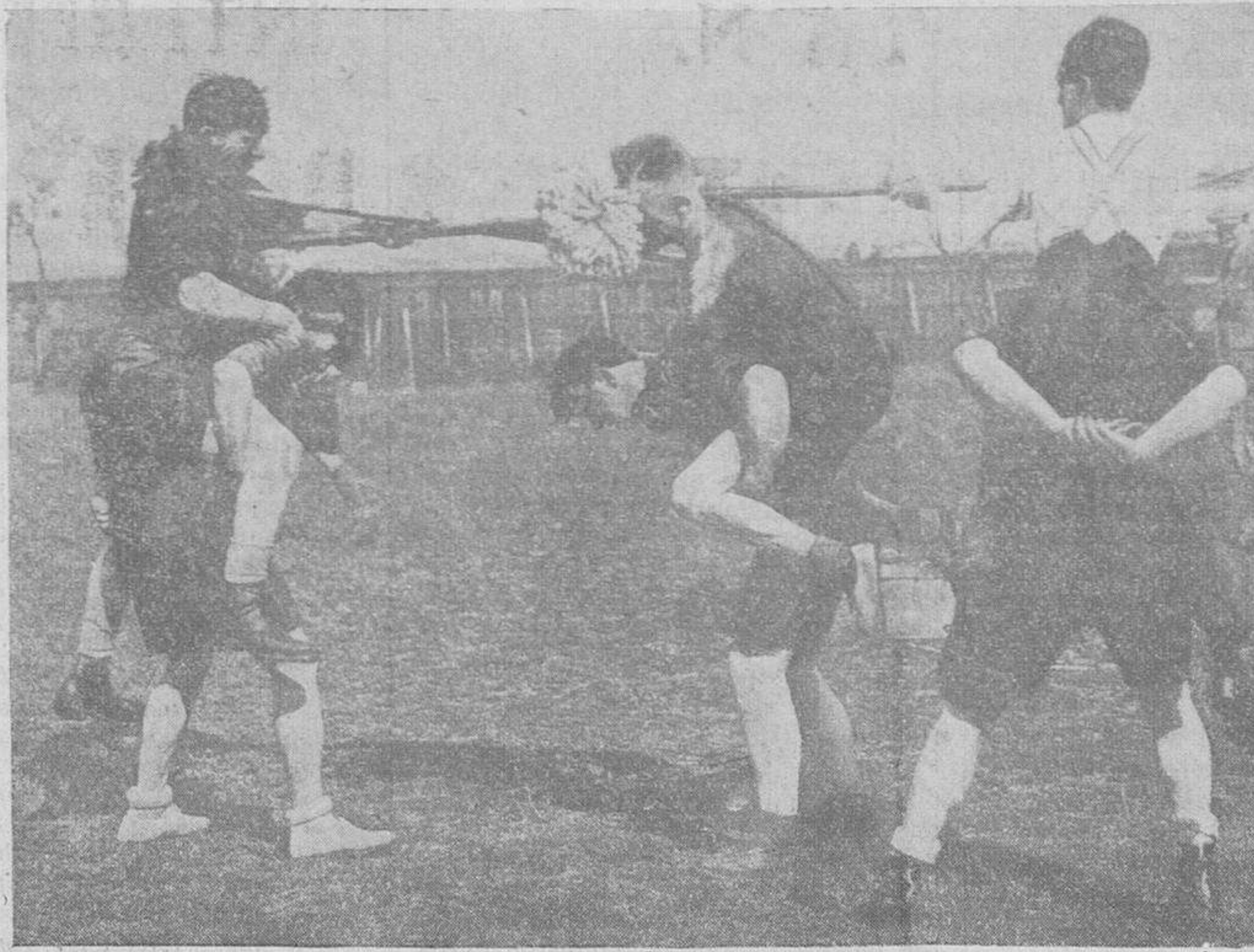
Jóvenes escoceses en un nuevo y humorístico deporte, en el que las escobas y el agua juegan un importante papel, así como las espaldas de los jugadores.