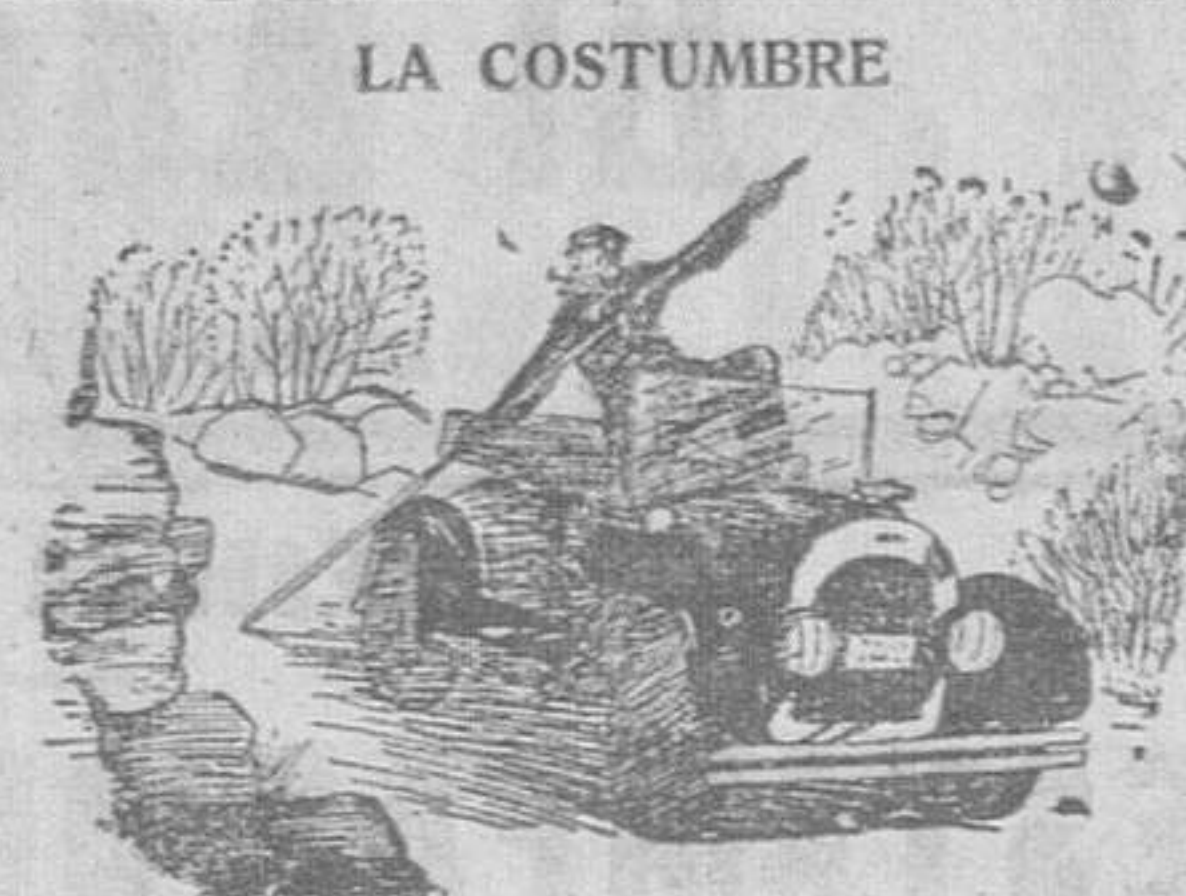
El marino retirado que ha comprado un automóvil.