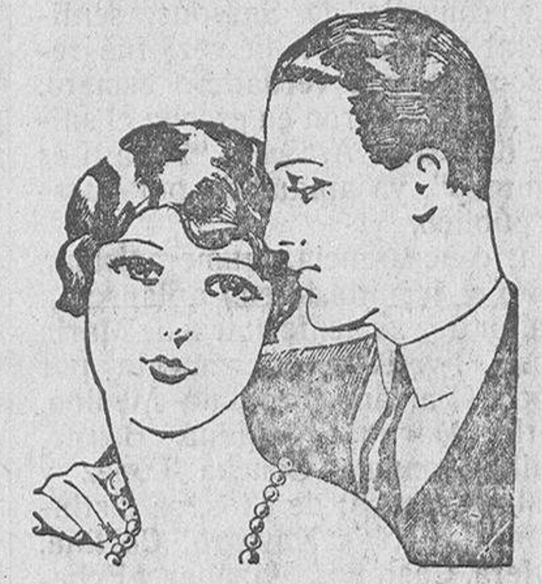
Damas pertenecientes a la alta sociedad, actrices y estrellas de cinematógrafo, tienen que ser bonitas: el prestigio y el éxito lo exigen así.

Consulta de diez a una y de cuatro a siete. Quintana, 5 y 7, principal.