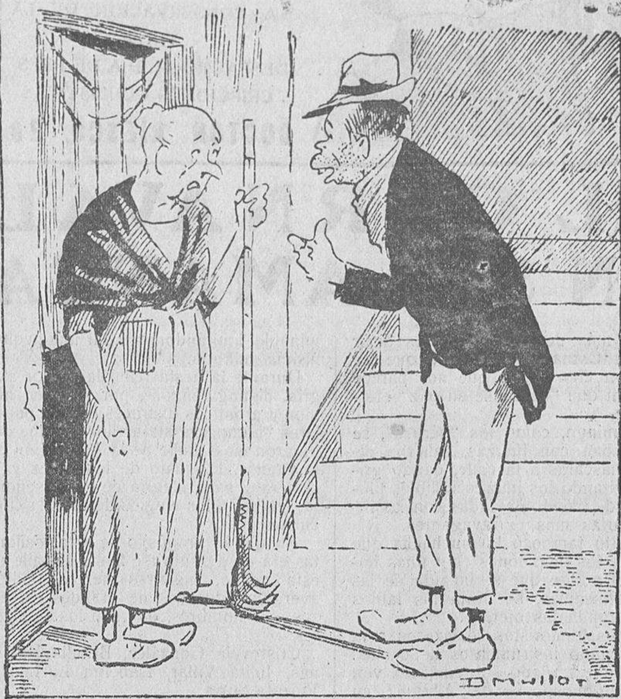
—Dígame, portera: ¿Viven aquí los inquilinos del primer piso?..