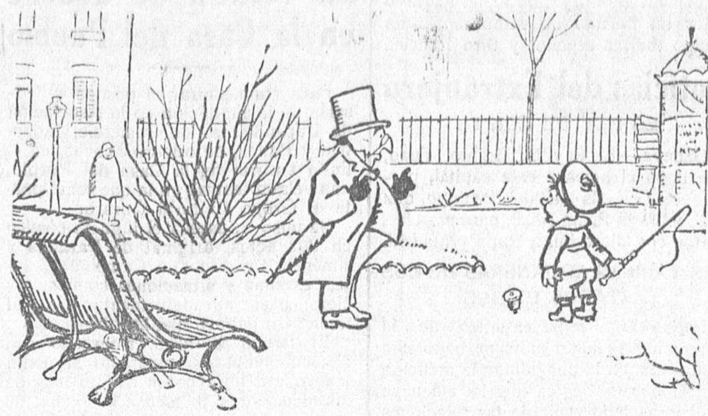
—Ten cuidado, hijo mío; mira que el juego es un vicio funesto.

La Compañía Nacional de los Ferrocarriles del Oeste de España, establecerá este año, como en los anteriores, un servicio especial de billetes de ida y vuelta, a precios reducidos, valederos por 90 días, con destino a Béjar y Hervás, con facultad para detenerse en las estaciones de Plasencia Ciudad, Baños de Montemayor y Puerto Béjar. Los billetes para dicho servicio especial, pueden adquirirse en todas las estaciones de su red, y en el Despacho Central de Madrid (calle de la Salud, 3), en el mismo día o un día antes del en que haya de emprenderse el viaje. Tanto en el citado Despacho Central, como en las estaciones de la Compañía, se facilitan prospectos con los precios y demás detalles.