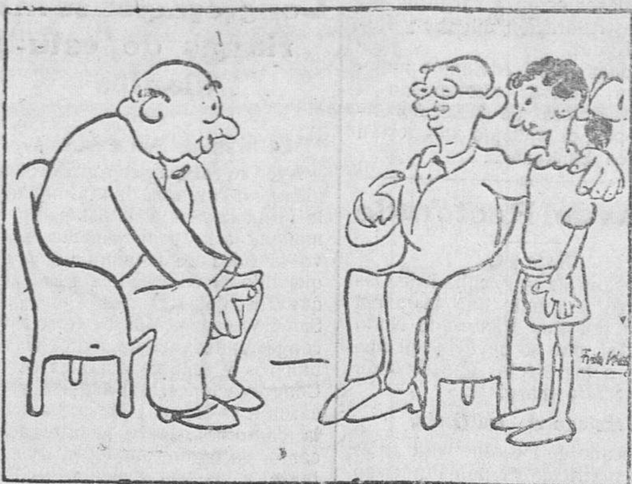
—¿Se parece a su padre el chiquito? —A la perfección. Como él, roe hace otra cosa que comer, beber y protestar.