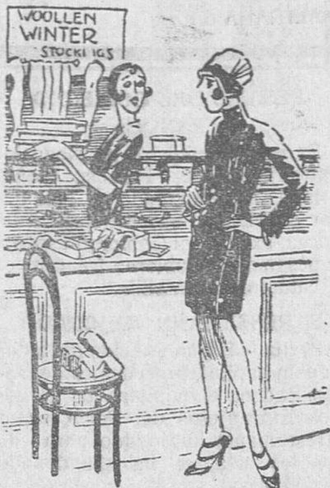
La compradora.—A ver, unas medias. La vendedora (antigua camarera).—¿Al natural, o con leche?

Madrid y otras importantes poblaciones, en las que, no dudamos que iniciarán la eterna luna de miel, que de todas veras les deseamos.