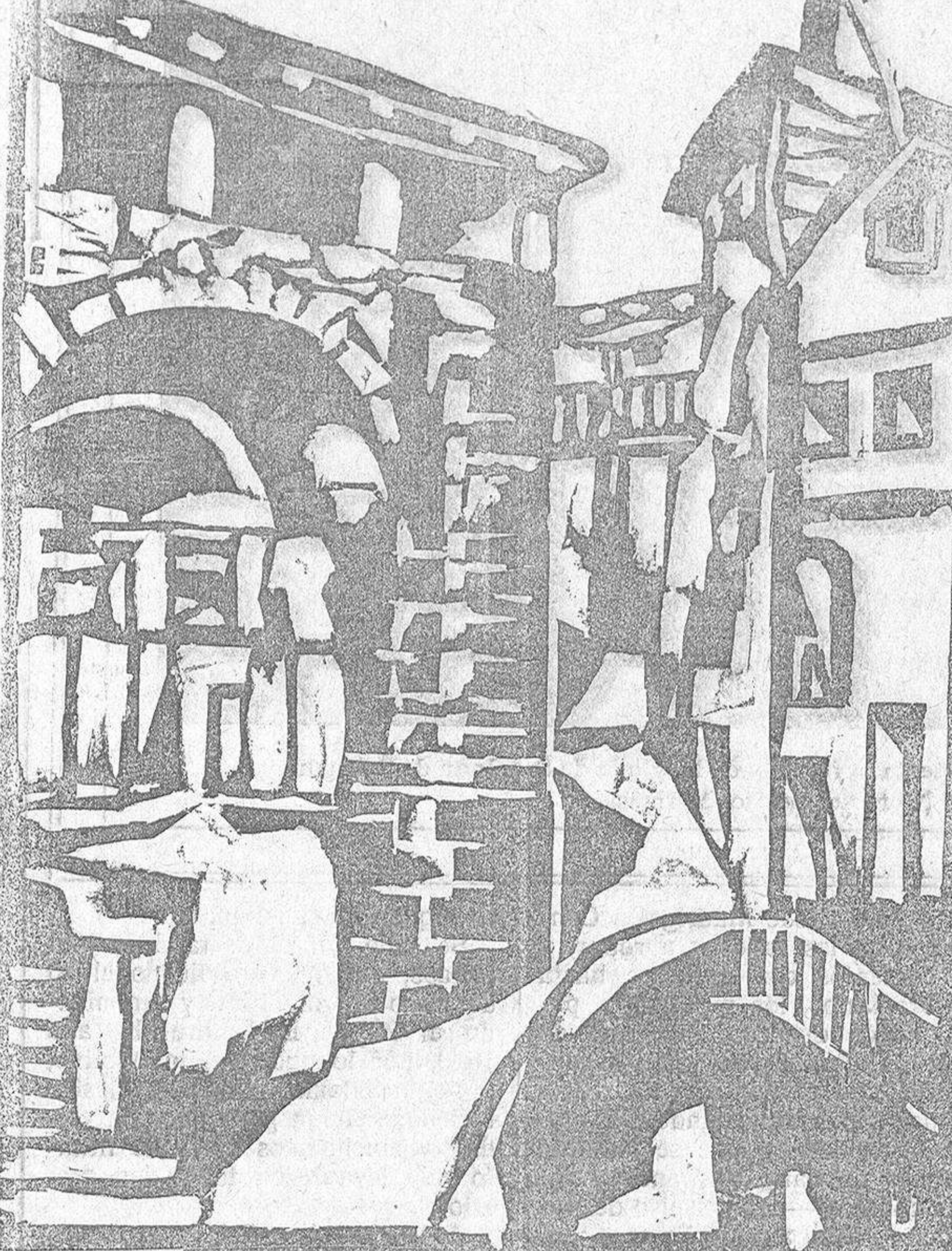
Linoleum, de José Manuel G. Ubierna.

En conjunto, nos parece la exposición de lo más logrado que