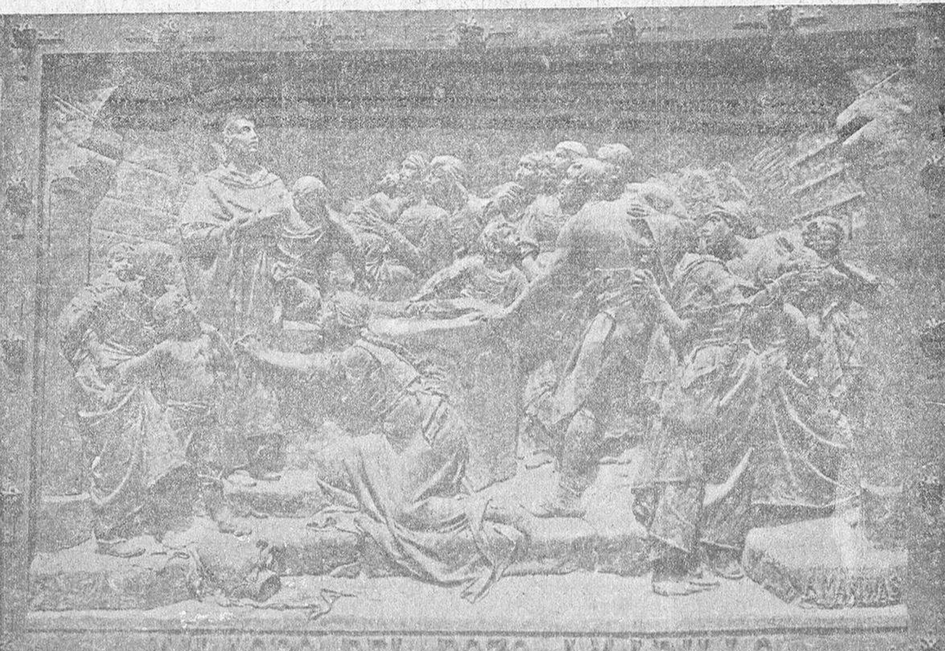
Otro relieve del mismo autor y que aparece en la misma fachada de San Juan de Sahagún.

ro y querido Agustino. Se sabe por datos también históricos, que fué beatificado el 13 de Junio del año 1601, y canonizado el 24 de Diciembre del año 1610, por lo que, con tal motivo, hubo en Salamanca grandes fiestas con iluminación general de la ciudad y muchísimos arcos de triunfo que levantaron todos los gremios. Ante los beneficios que este Santo había hecho en Salamanca, el Ayuntamiento le nombró, en honra y gloria suya, Patrón de esta ciudad, lo que se verificó el 5 de Junio del año 1602. Después de haberse celebrado en fechas diferentes, fiestas eclesiásticas en su honor, y de implantar en todas las