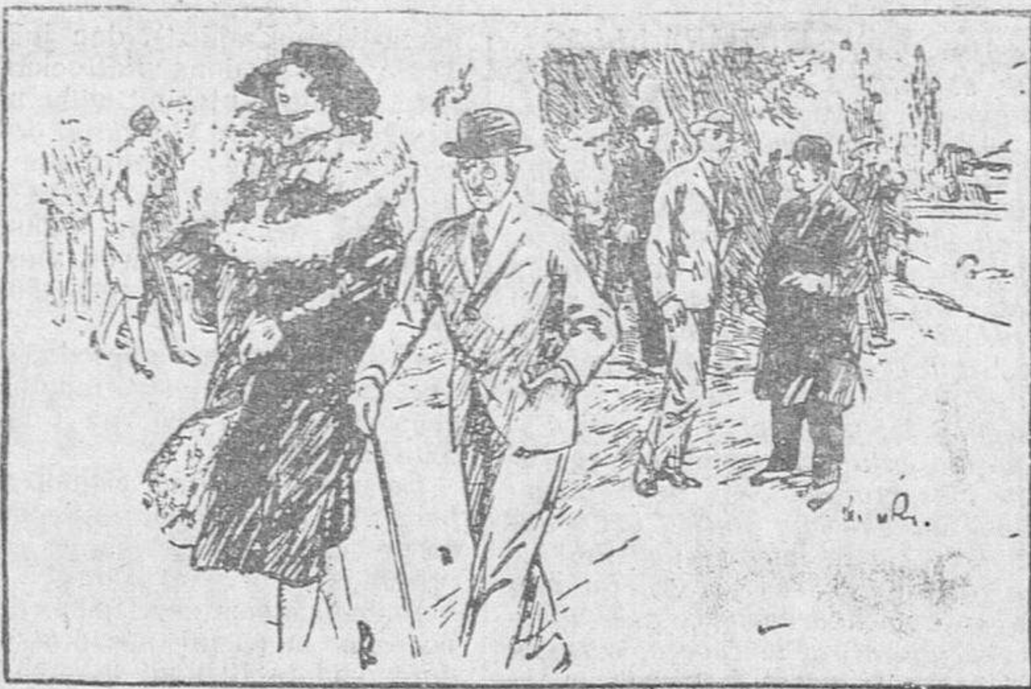
—¿Ser in marido y mujer? —Al contrario. Son muj y m: rido.