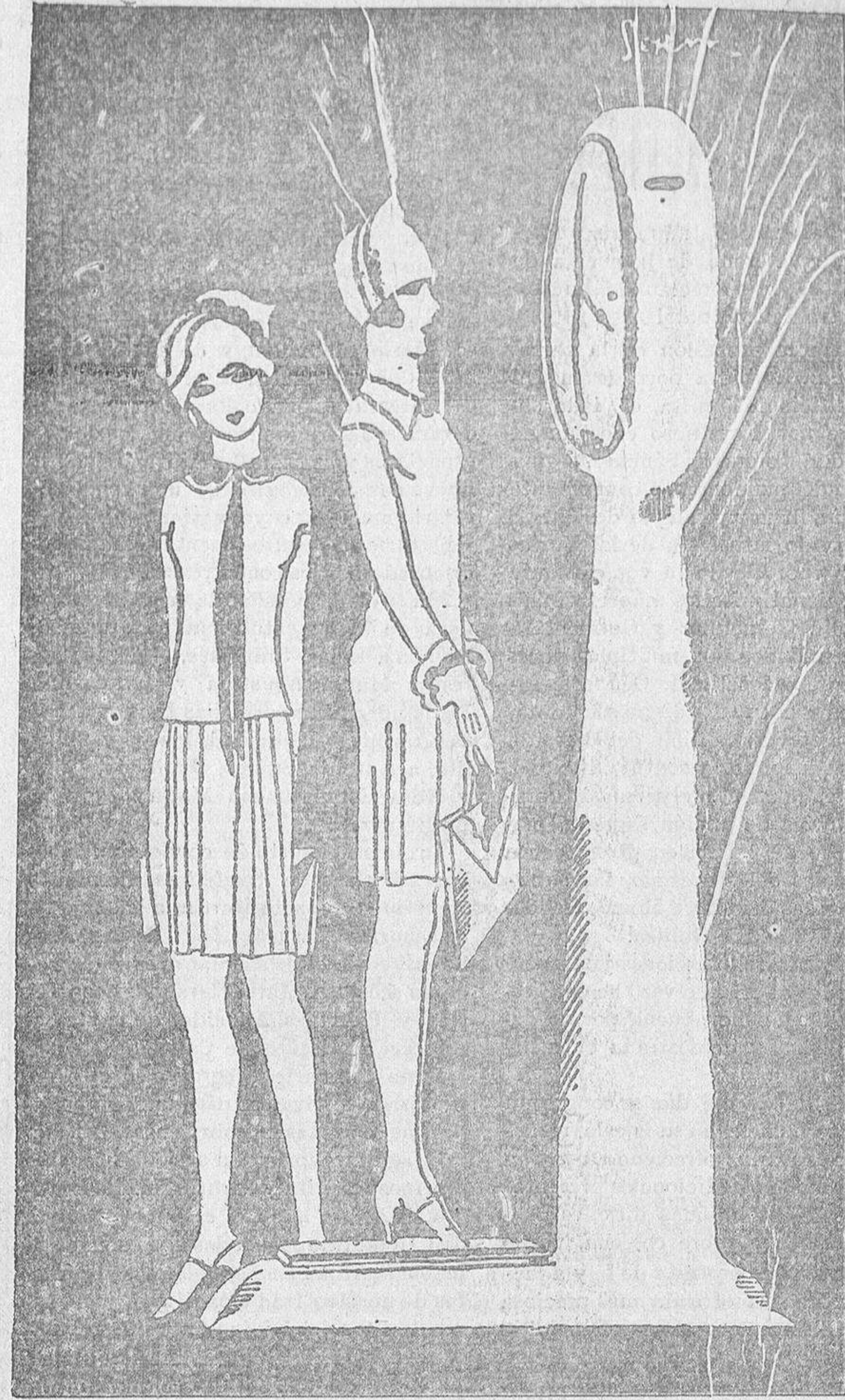
No te preocupes porque peses más. ¿Sabes qué he hecho yo para no engordar? —¿Qué? —No pesarme.