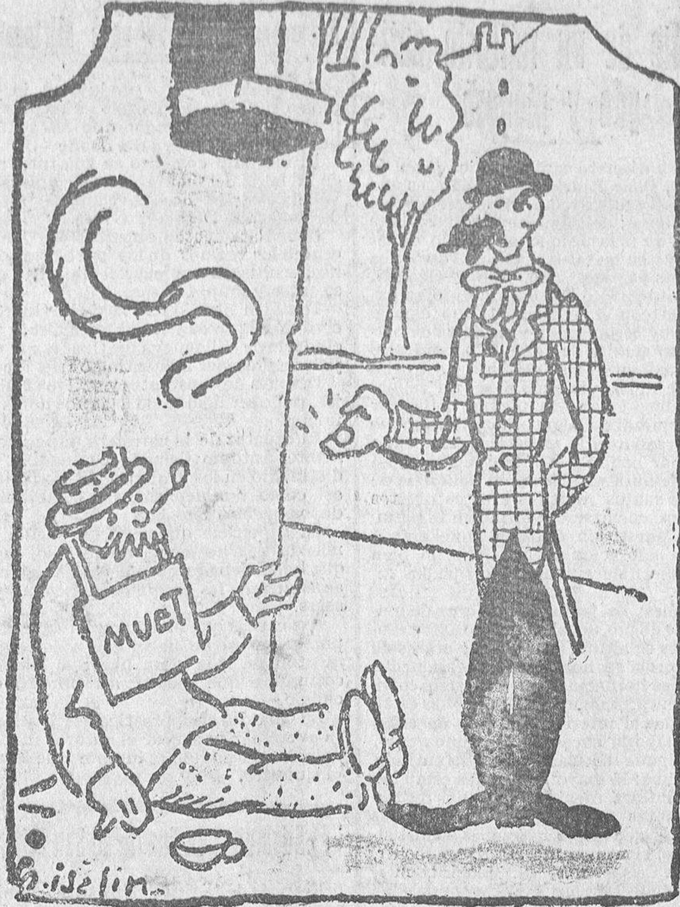
LOS HAY «FRESCOS»