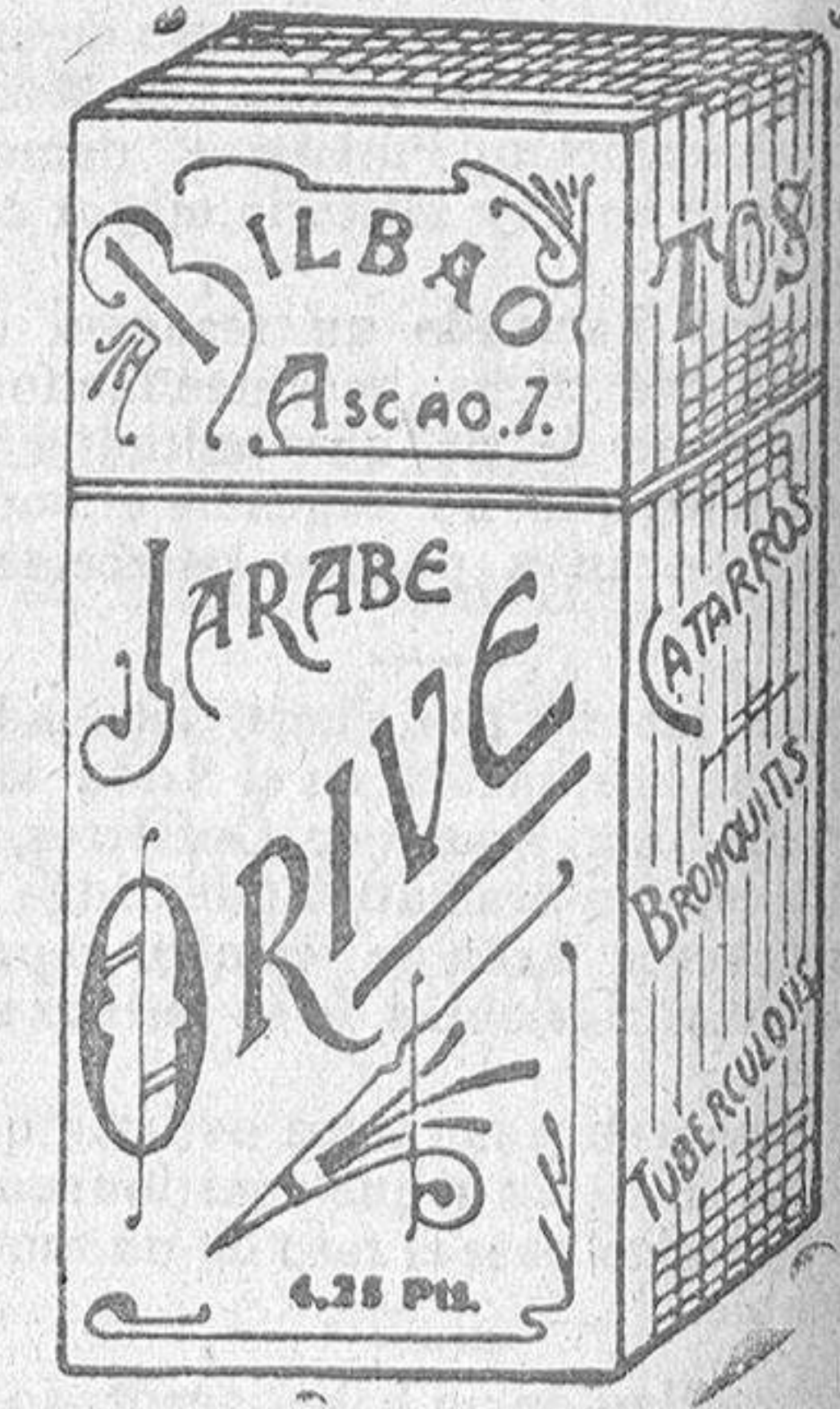
El mejor remedio para el peor catarro Jarabe Orive. Precio, 4,25 pesetas.