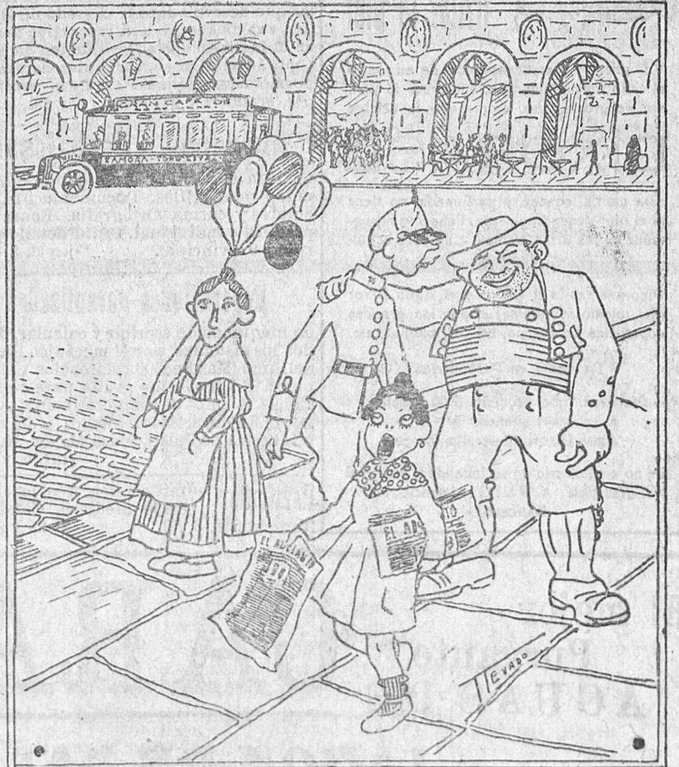
—Yo conozco a su hijo, está en mi regimiento y ahora se ha hecho gastador. —¡Vaya una noticia!, eso lo fué siempre en el pueblo.

Sobre este asunto, terminó declarando el Gobernador civil, que atendiendo la Junta de abastos a determinadas