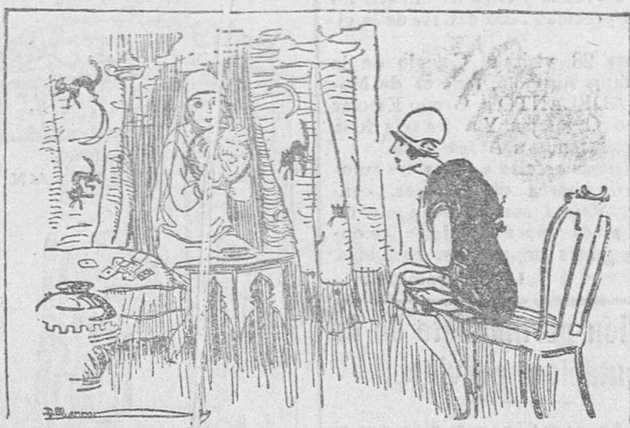
La echadora de cartas.—Su marido será valiente, generoso, guapo y rico. La joven.—¿Qué gusto Y dígame, ¿qué debo hacer, para librarme del que tengo ahora?

serviéndose en La Alberca un refresco, durante el cual se ejecutaron bailes por varias parejas, con trajes típicos de la región.