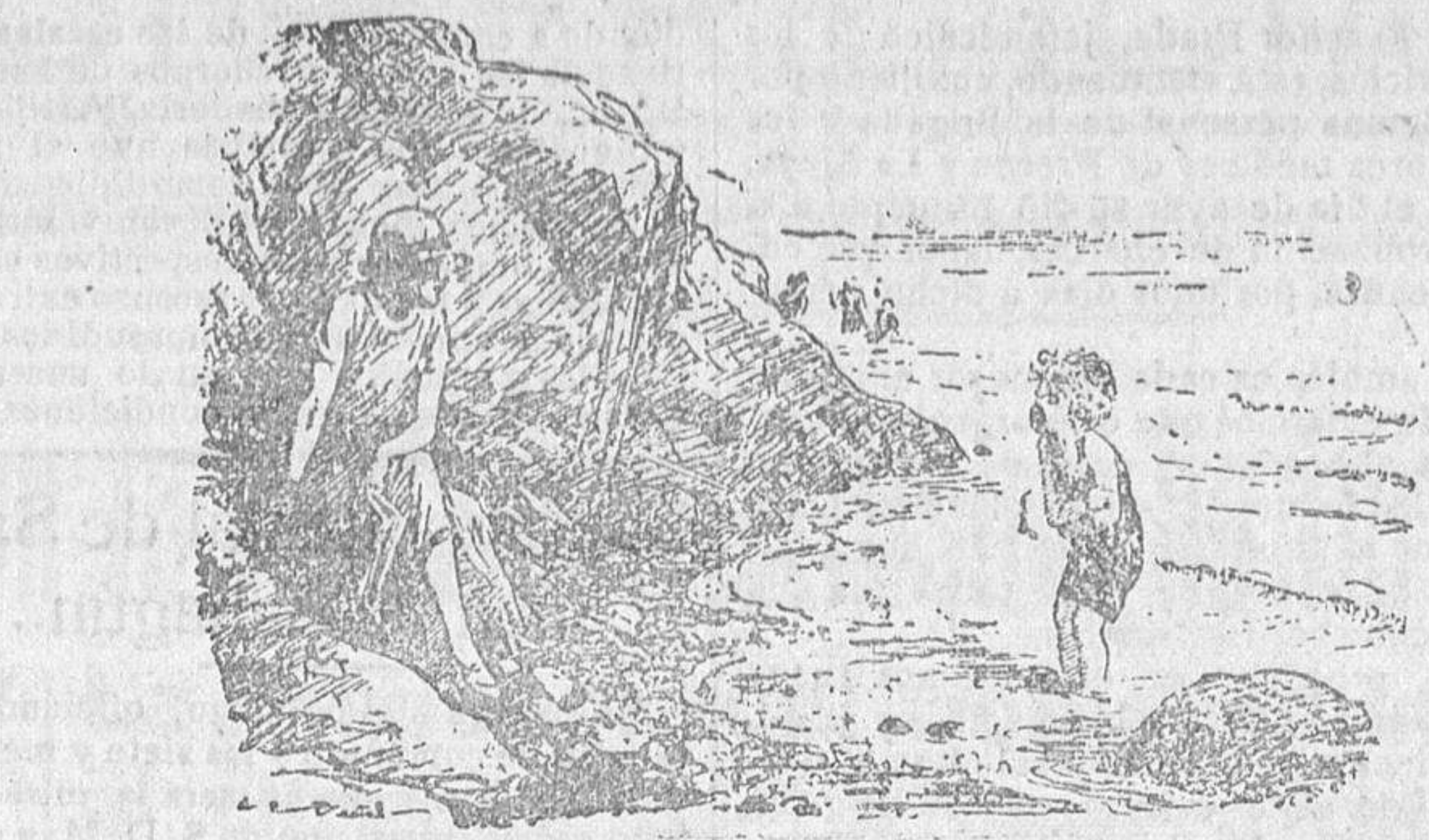
—El niño al tomar su primer baño de mar. —Oye, mamaita, bien podían calentar un poco el agua, porque está muy fría.