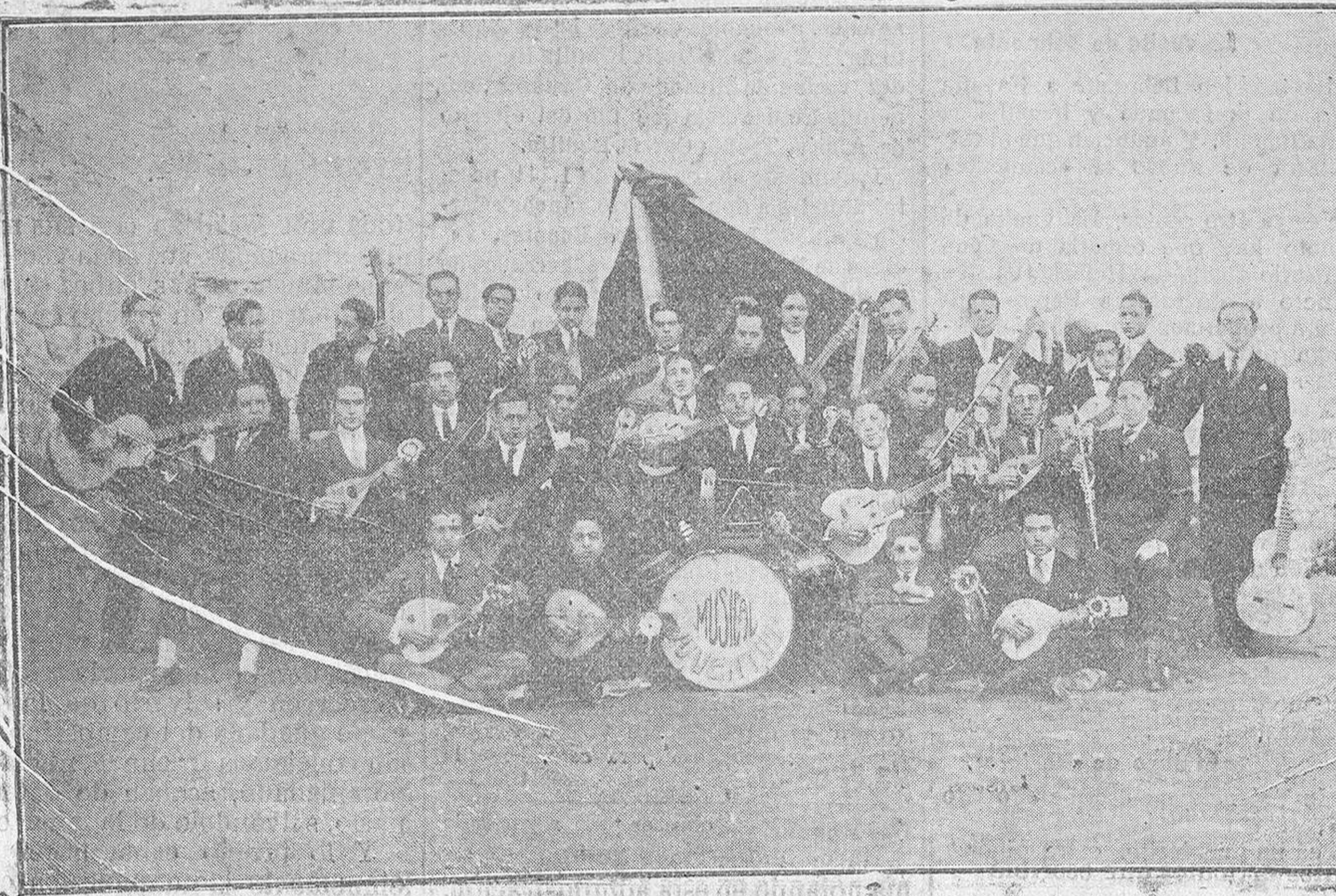
Los simpáticos muchachos de Juventud, que después de haber tenido en nuestra ciudad una gran acogida, salen mañana para Valladolid.