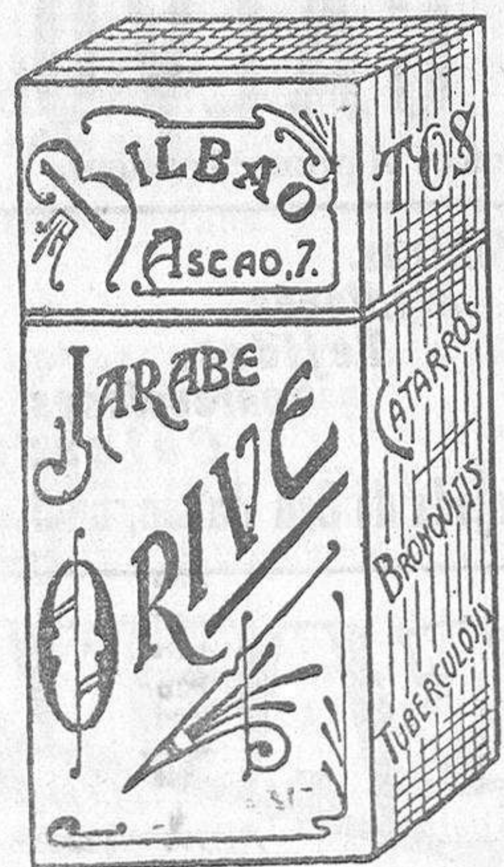
El MEJOR remedio para el PEOR catarro, Jarabe Orive. Precio: 4,25 pesetas.

Anticipamos a los empresarios otro lleno hoy.