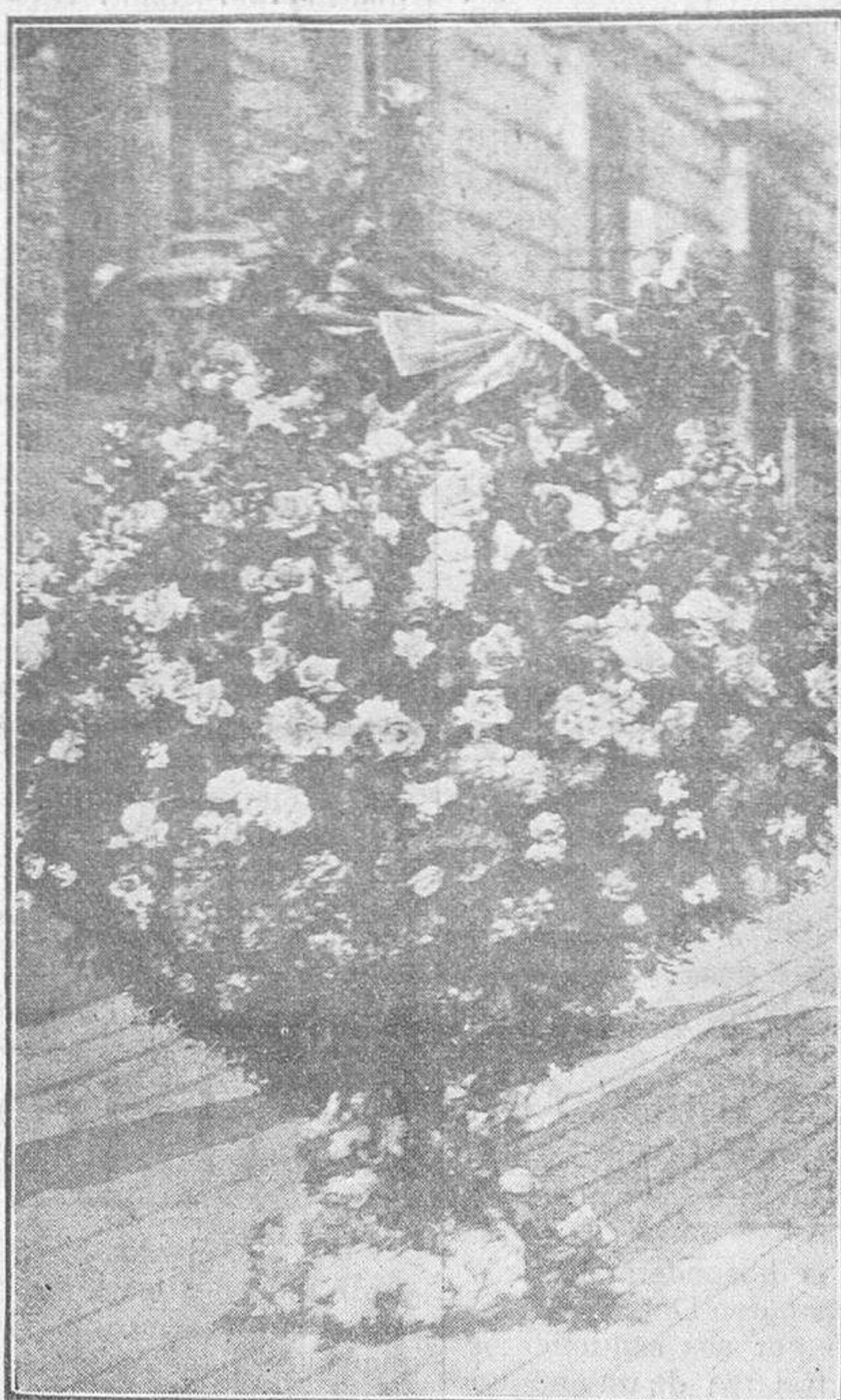
Madrid. Homenaje a su majestad la reina. - Cesta de flores ofrecida a su majestad la reina por la unión de damas del Sagrado Corazón, en nombre de las mujeres españolas.