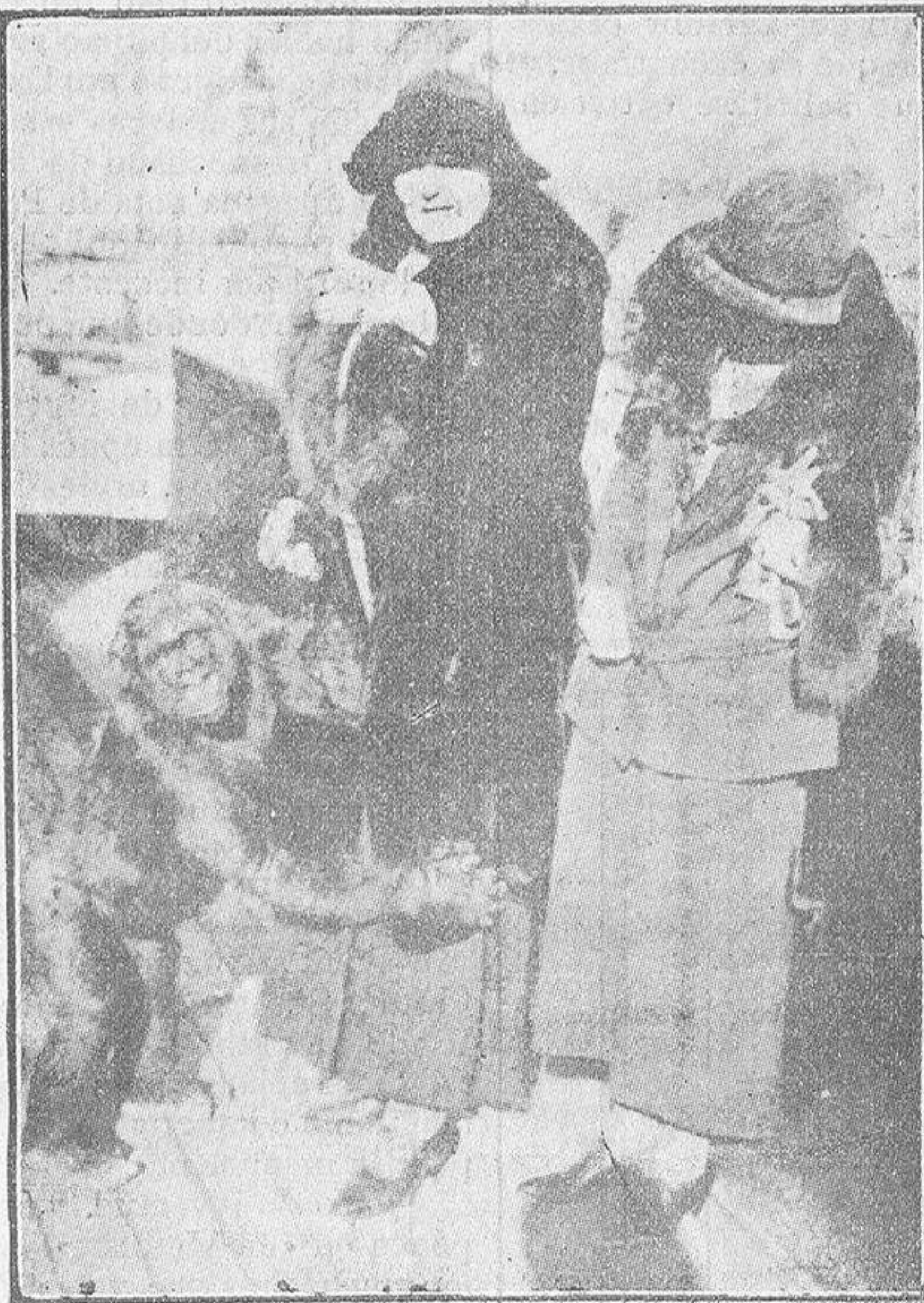
El famoso mono John Daniel, del circo de Nueva York, que ha embarcado con su domador para Europa, a fin de contraer matrimonio con la bella Jennie Lind, distinguida orangutana del Parque Zoológico de Londres.