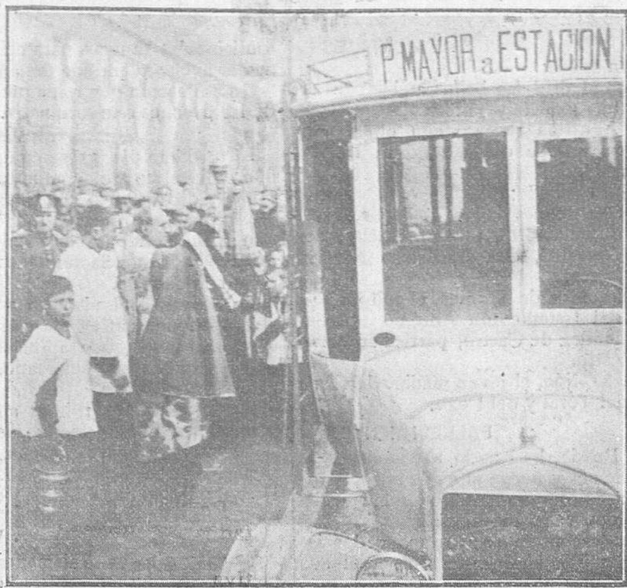
El acto de la bendición, en la Plaza Mayor, de uno de los autobuses que circulan por Salamanca.