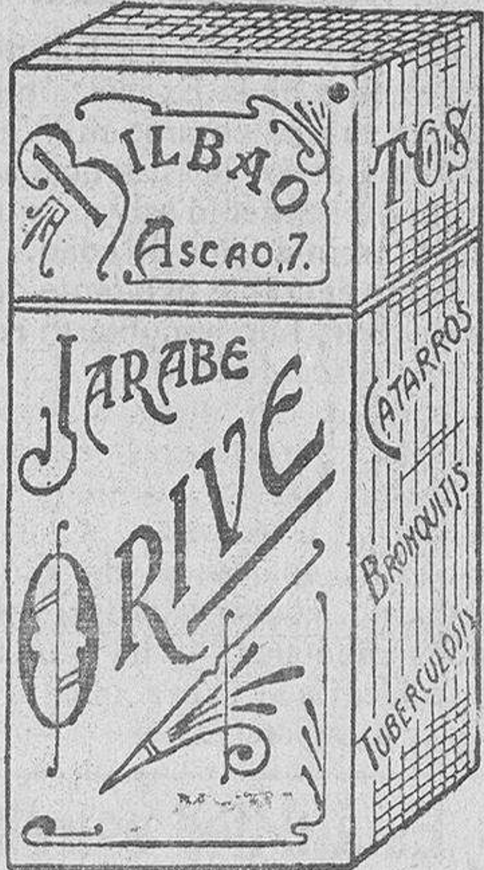
El mejor remedio para el peor catarro, Jarabe Orive.