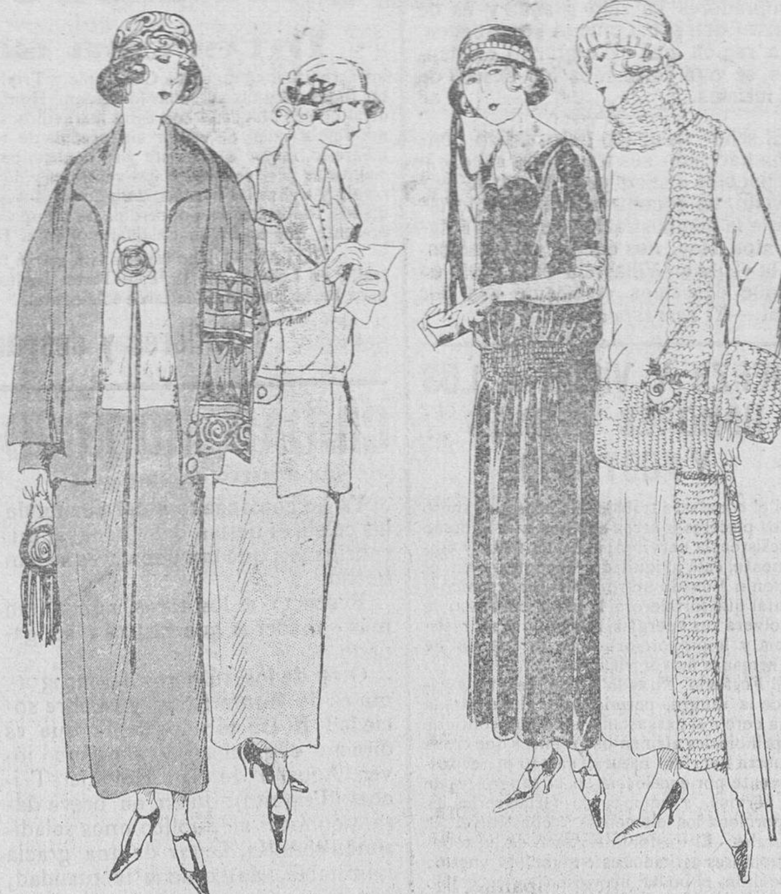
Figs. 1, 2, 3 y 4.