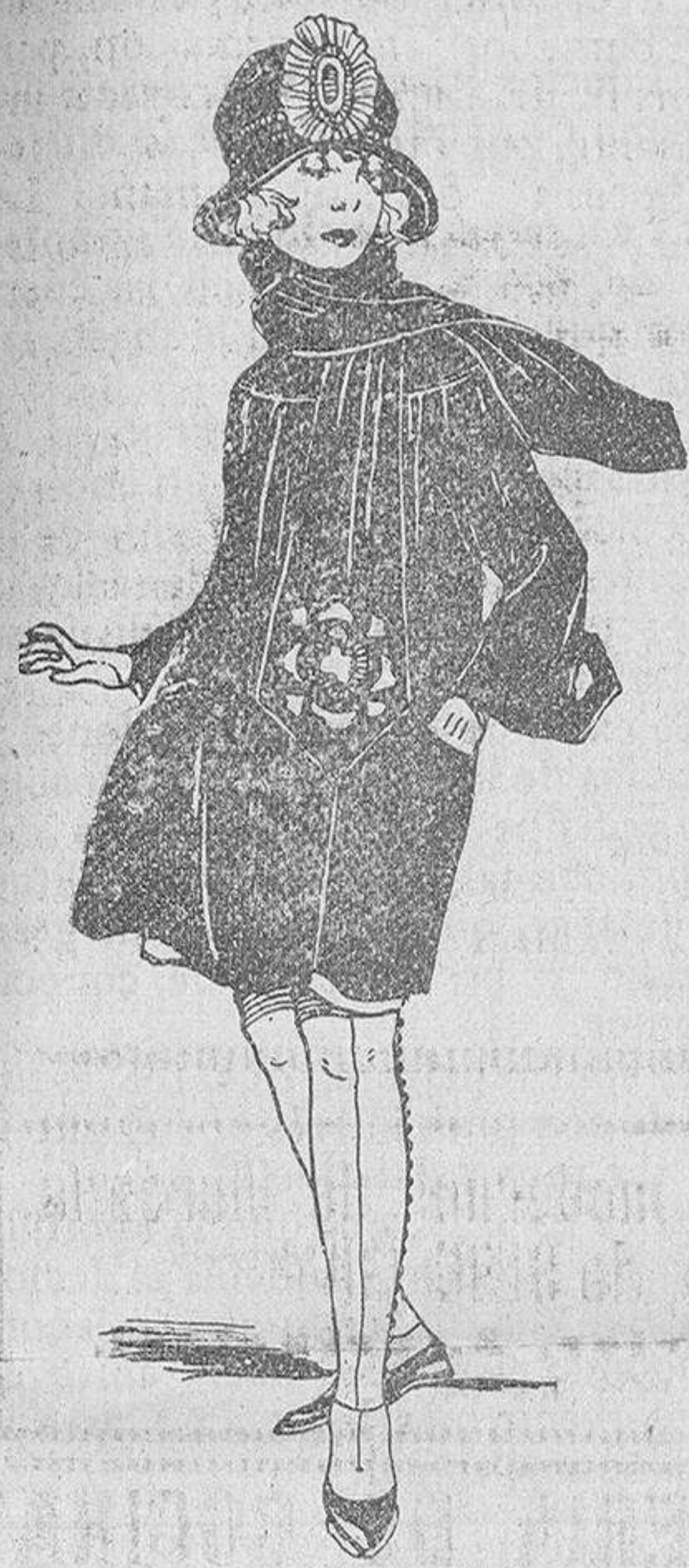
Fig. 5. a

puro salmantinismo, que nuestros escritores locales volvieran por los fueros de sus prestigios y rememorasen, en una labor depuradora, los méritos de la escritora salmantina Matilde Cherner.