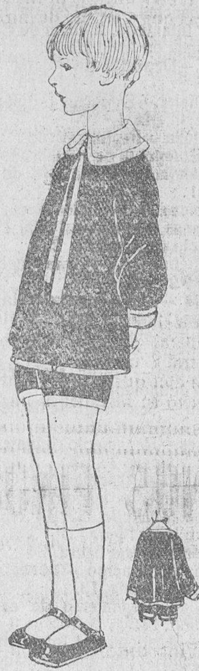
Fig. 6. a

¿Qué hay de más suave que un cojín compuesto de piel de conejo coral y blanco, por ejemplo? Alrededor, simulando un volante, escudra el cojín una banda de piel blan-