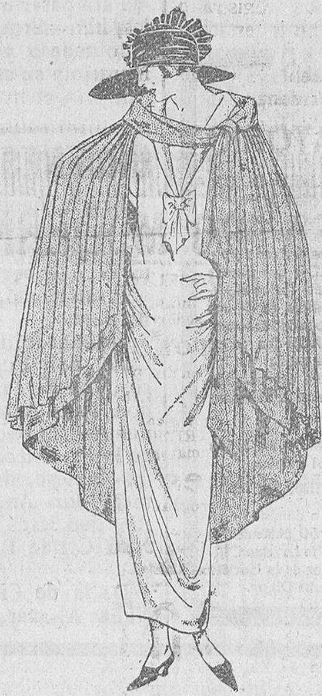
Fig. 7. a

Una vez terminado el bordado, se procederá a armar la labor. Los montantes de la armazón de latón se recubrirán desde luego con cintas, o torzal de algodón. Se preparará después la tira de tul plisado o fruncido, teniendo mucho cuidado de seguir los agujeros del tul para cortar la tira exactamente de la misma altura; poner después el redondel de tul de encima y el lienzo bordado. Los dos bordes de la tira están rodeados de un cordón.