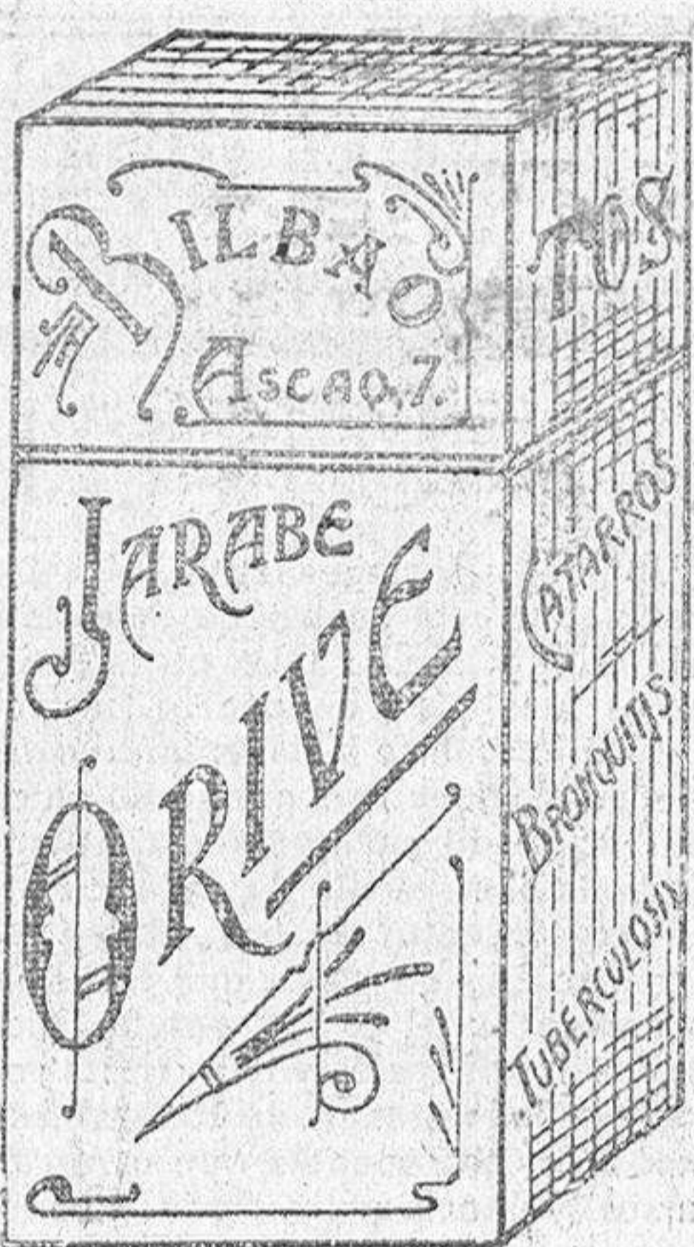
El mejor remedio para el peor catarro, Jarabe Orive.