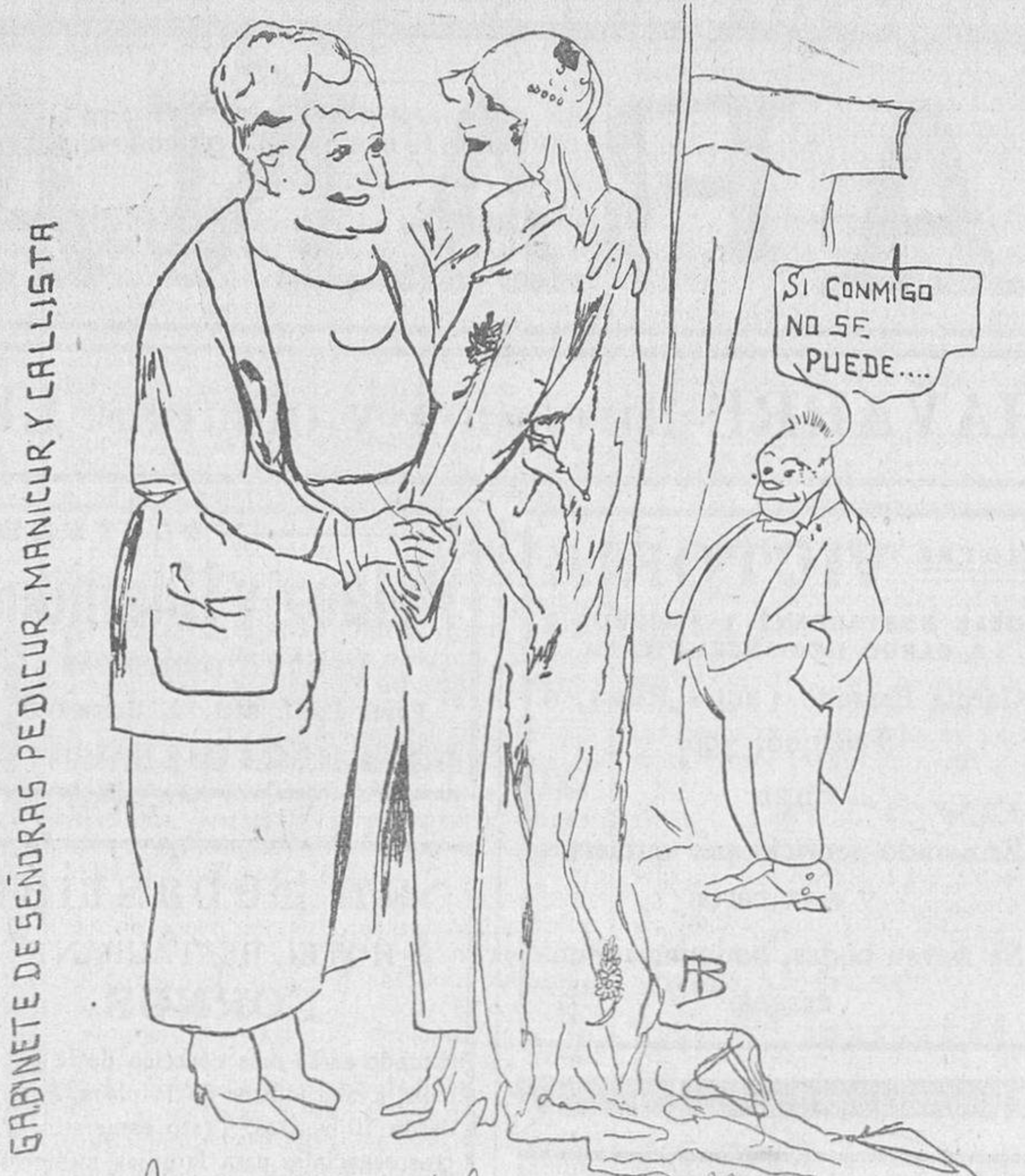
GABINETE DE SEÑORAS PEDICUR, MANICUR Y CALLISTA