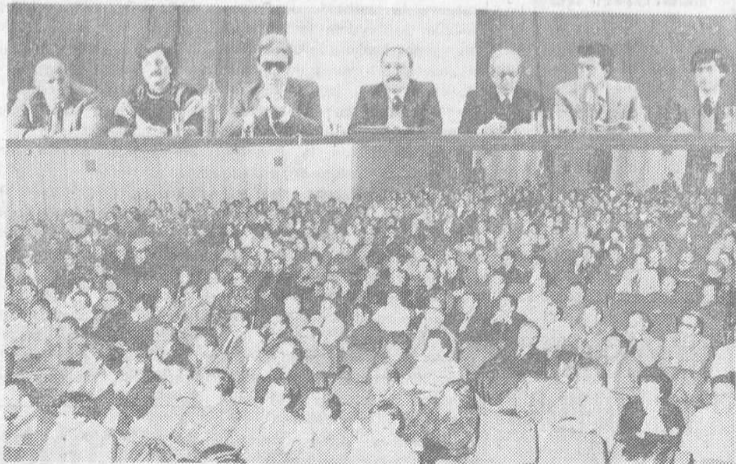
Presidencia y aspecto de la sala de butacas del «Gran Teatro», donde ayer celebraron una asamblea los comerciantes burgaleses. — (Fotos VILAFRANCA).

Al mismo tiempo los empresarios burgaleses señalaron que estos grandes centros de venta no generan puestos de trabajo e inciden de una forma muy directa sobre los comer-