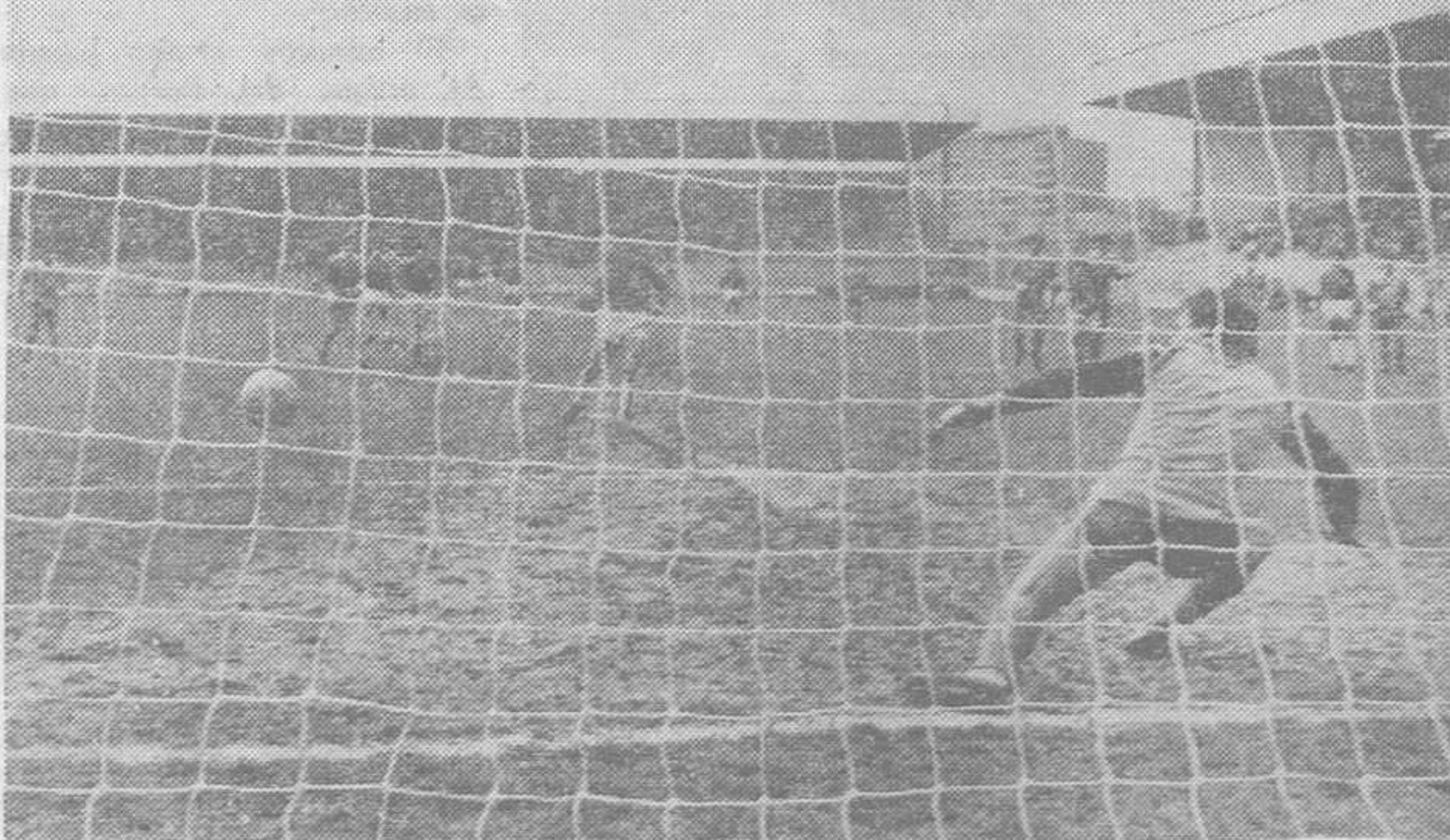
Cinco goles hizo el Real Burgos sobre el Cacabelense. Y, la verdad es que pudieron ser bastantes más, porque en el descanso ya señalaba el marcador un rotundo cuatro a cero favorable a los de casa. Luego, en la continuación, la tónica del juego varió, desgraciadamente y la goleada que se aventuraba no llegó.