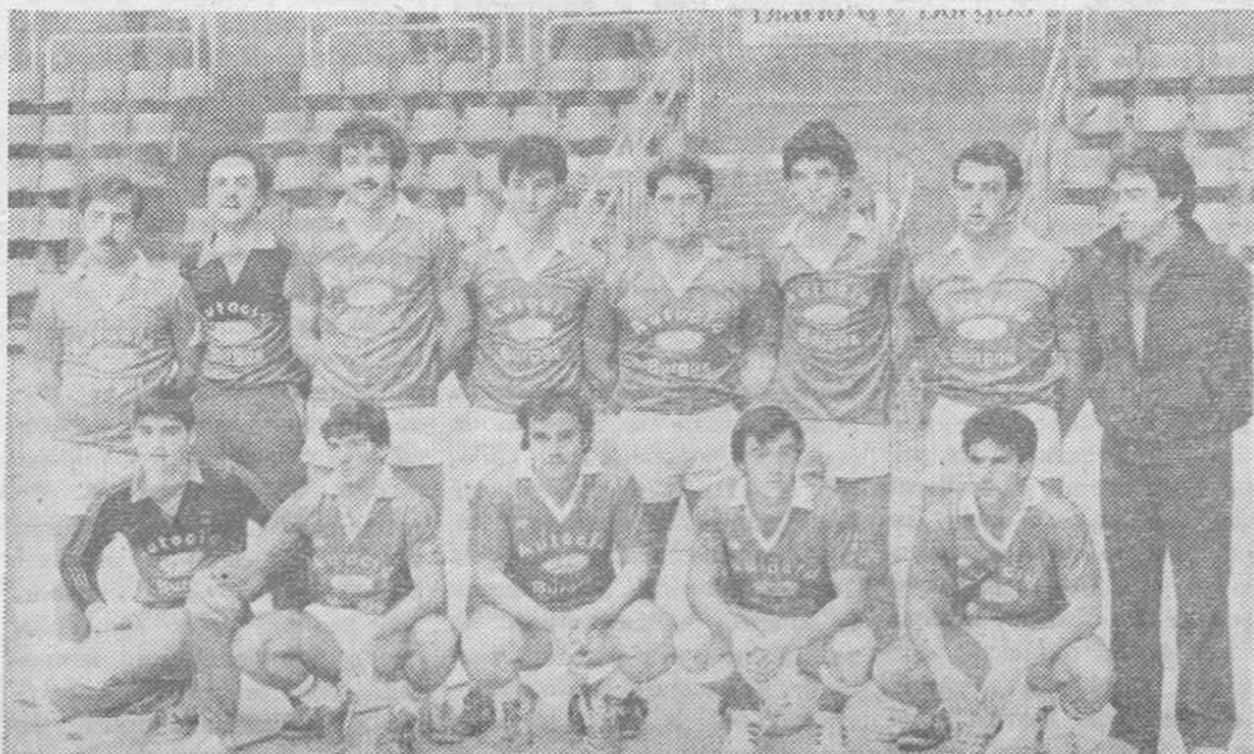
En esta foto de archivo observamos al Autocid que con su triunfo en Venta de Baños jugará la fase de ascenso a Primera.