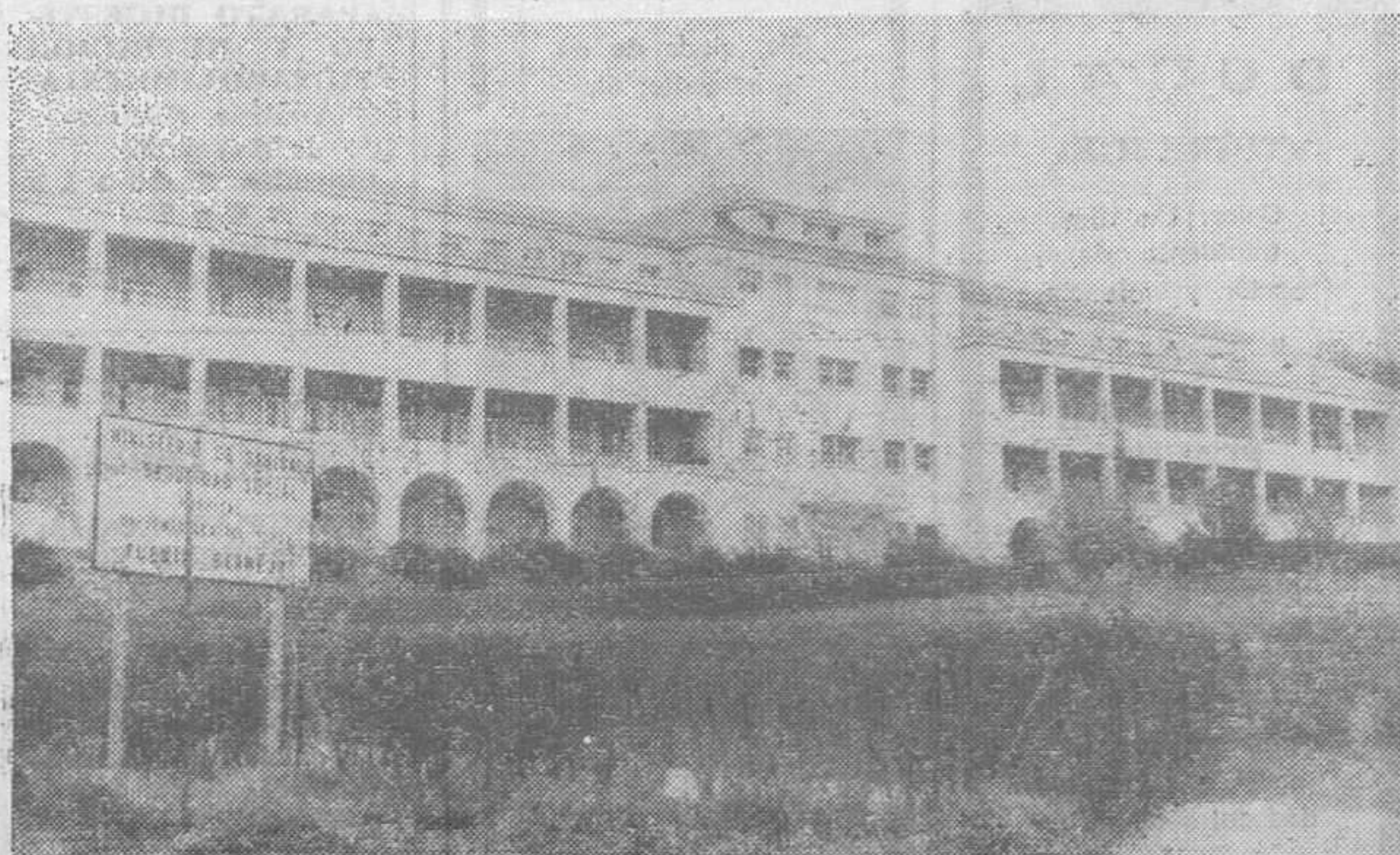
Fachada exterior del sanatorio de Fuente Bermeja, construido en la década de los sesenta.