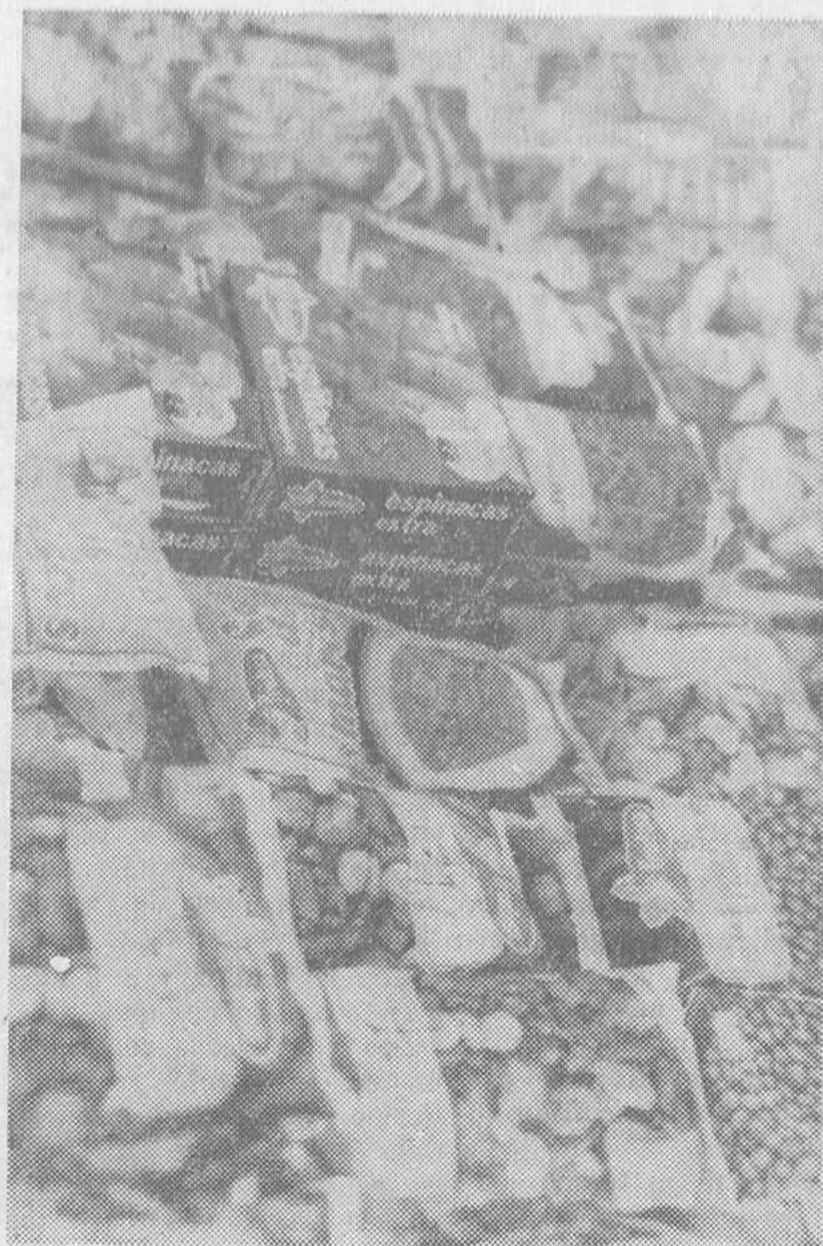
Antes de comprobar es necesario comprobar el empaquetado.

—En general no creo que haya diferencia de calidad, sabiendo descongelarlos. Quizá las verduras sean peores.