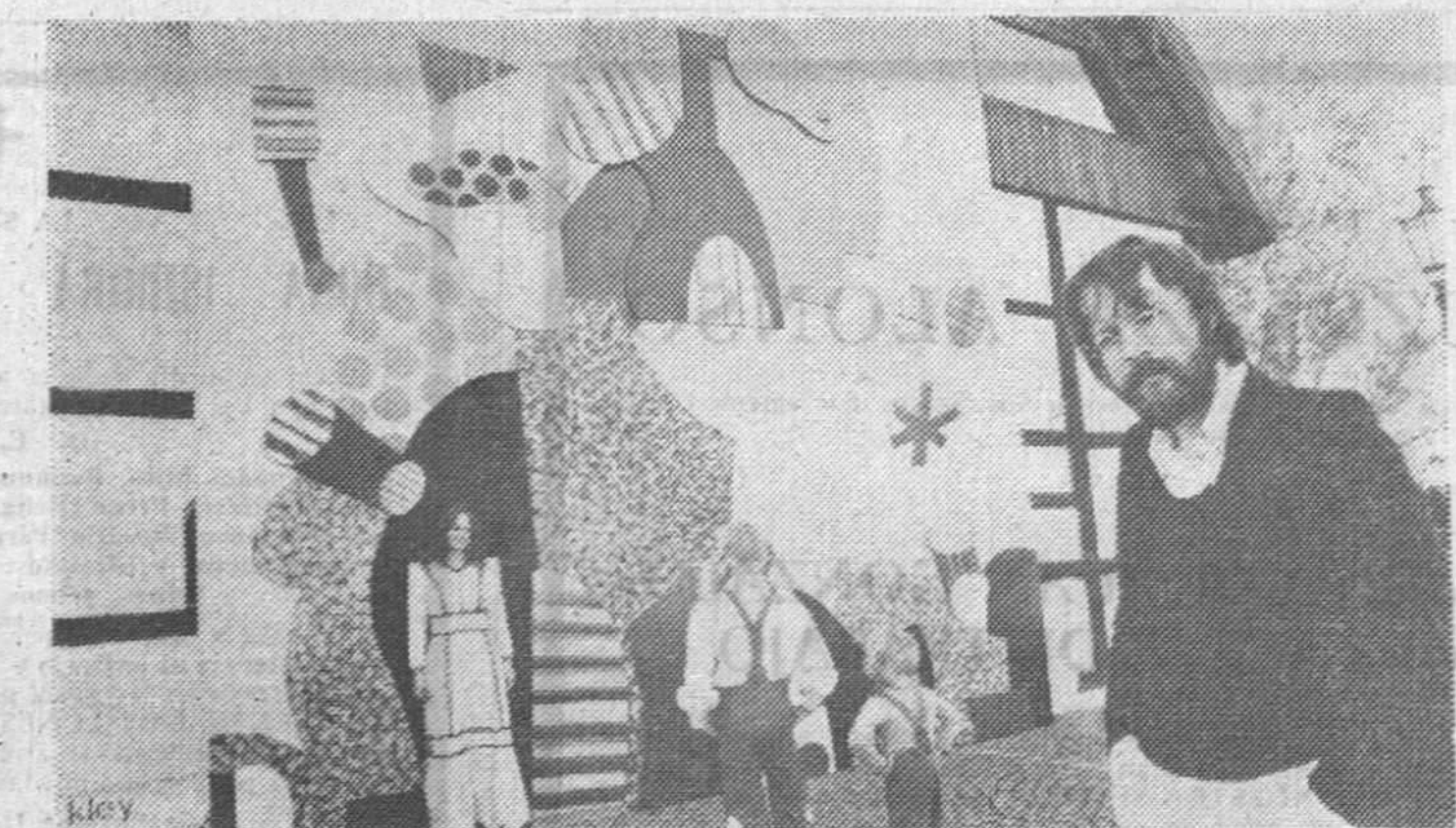
Otmár Alt, pintor de 30 años, expone actualmente sus obras en una casa de campo austriaca. Ante la puerta ha colocado este gigantesco «collage» que es practicable puerta que se pasa al interior a través de una puerta abierta en el monumental cuadro. La originalidad es indiscutible.