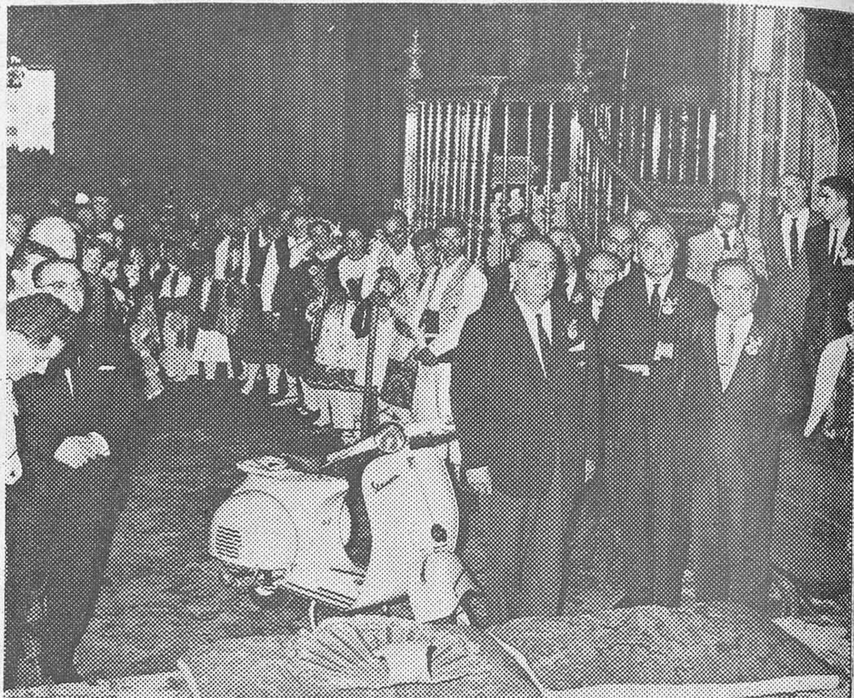
deportiva o religiosa, como en el caso romano y en este de Compostela y soporta sobre sí los gastos fabulosos que ello supone, los quebraderos de cabeza que origina la marcha controlada y absolutamente gratuita para quienes participan, y no quieren nada a cambio, nada fuera de esta alegría íntima de haber proporcionado a España un nuevo motivo de admiración extranjera, a Compostela una masa de peregrinos y al Apóstol un puñado de oraciones en común, como símbolo de millones de oraciones de todos los vespistas que en el mundo son y que estos mil representaban... E. DEL C.

De nuevo, Vespa ha sabido hacer acto de presencia en un suceso trascendental, y al margen de cualquier manifestación meramente comercial y publicitaria. Cuando pretende eso, lo hace; pero cuando, como en la peregrinación a Roma, en los raids internacionales y en las competiciones europeas de "Las Veinte Provincias", pospone toda razón comercial a la indus-