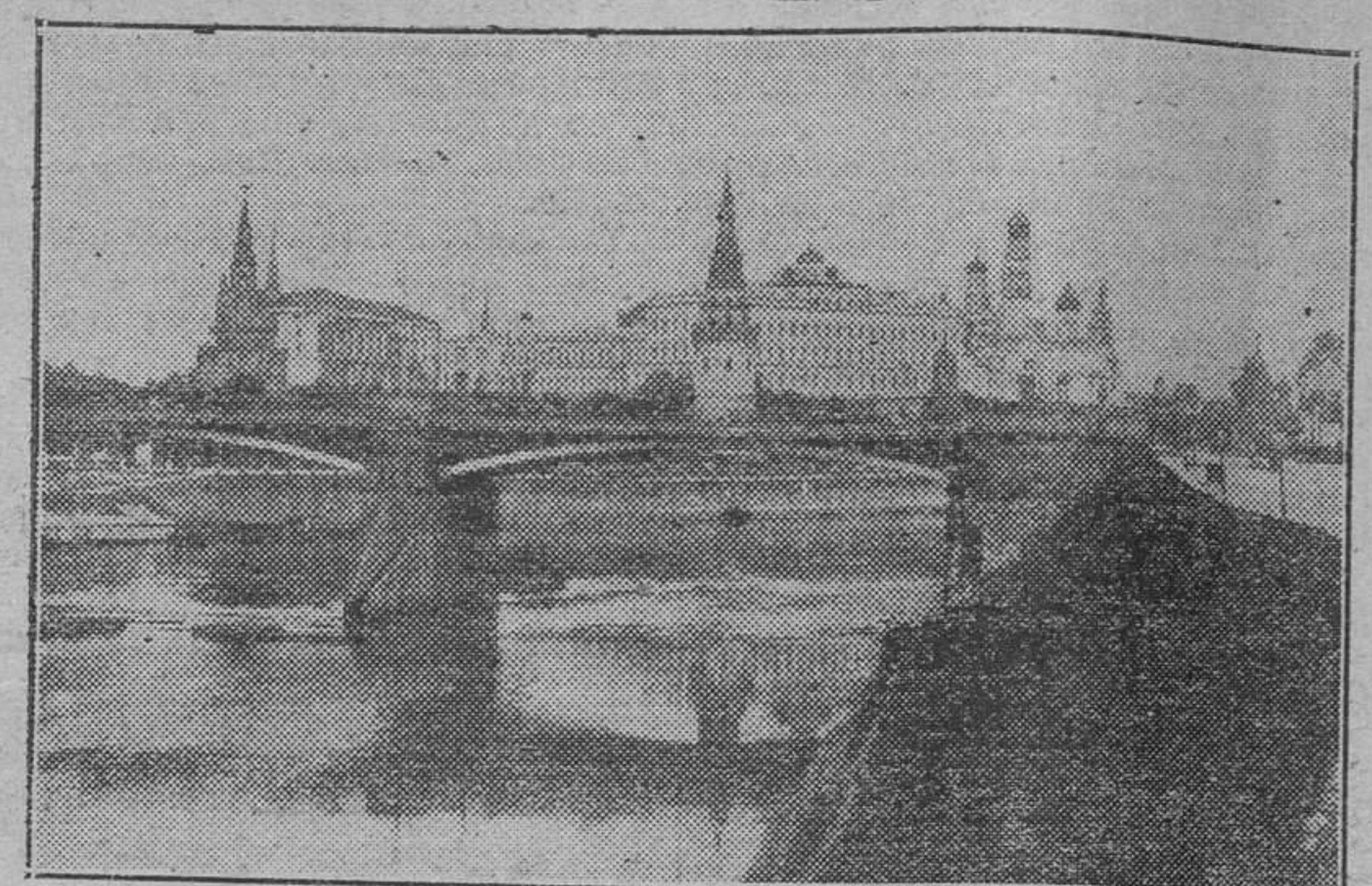
El Kremlin de Moscú. Vista tomada desde el río Mostwa