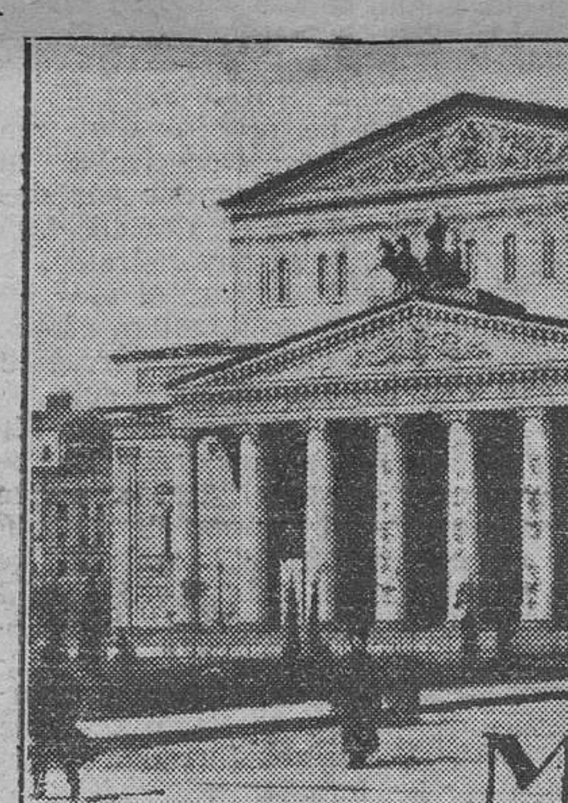
El Gran Teatro de Moscú