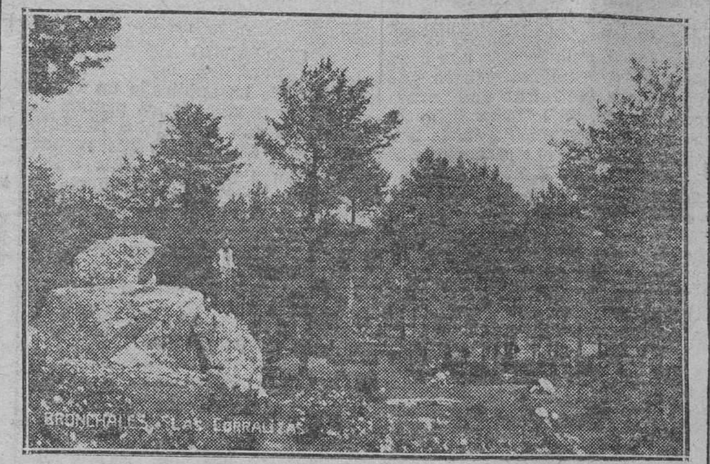
Las Corralizas, bellísima altura donde el bosque tiene pequeños claros que son jardines, incomparables.

Es vano advertir que en cualesquiera sitios de verano, en los que el barranco tiene un lecho blanco. Es un prado en el que hay algún que otro matorral. A un lado y a otro, la pendiente es rápida, áspera, pedregosa, desnuda de vegetación. Aunque el sol caiga a plomo, el viento es fresco y el calor no se siente.