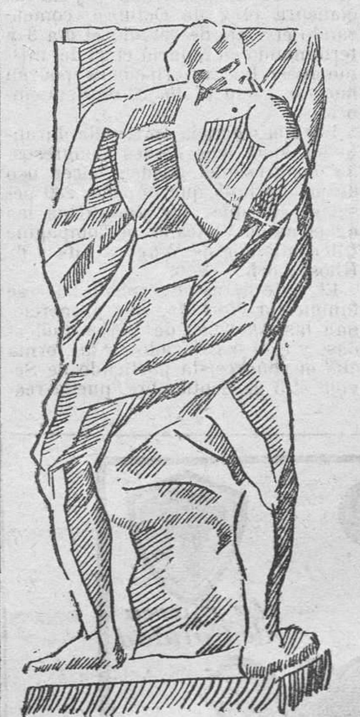
El Nano del carrer de En Llop, visto por Vercher

Seguidamente y a tiempo de ponerse en marcha la galera, se disparó una lucidísima traca, terminando así un festejo de la más rancia esencia popular, despedida adecuada a una época, sin larga serie de discursos, ni carácter oficial; organizada por el pueblo y para el pueblo.