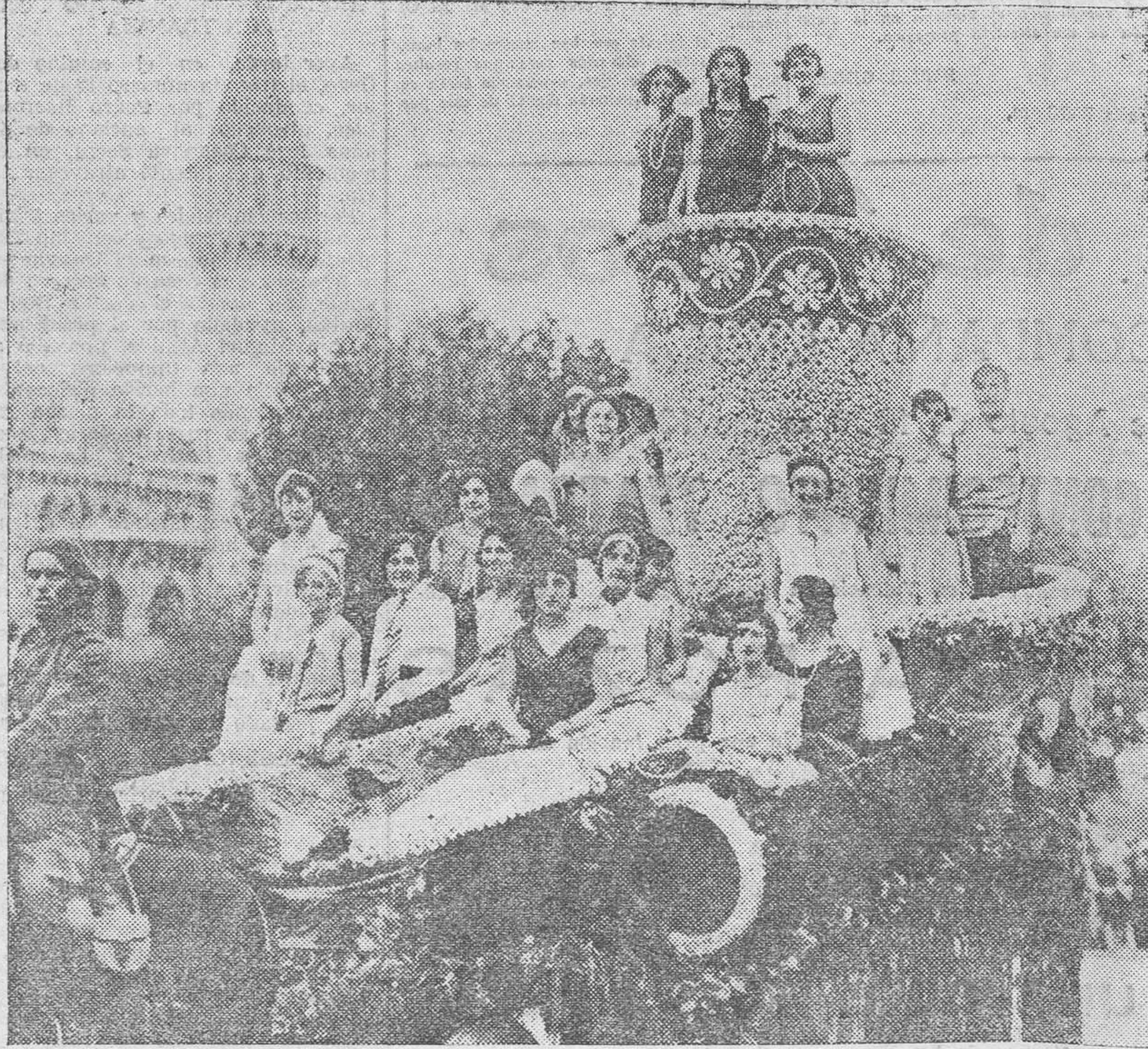
Las modistillas esparcen su alegría en la rista de la Alameda

el carácter de su poesía toda, no es la mujer ya hecha, susceptible de ser dominada por una pasión, sino la niña mujer, a quien ya le cansan los juguetes y a quien todavía le asustan los amores. Ved qué refinado, qué pulcro aparece el poeta al describirnos a Galatea en la ribera del mar: