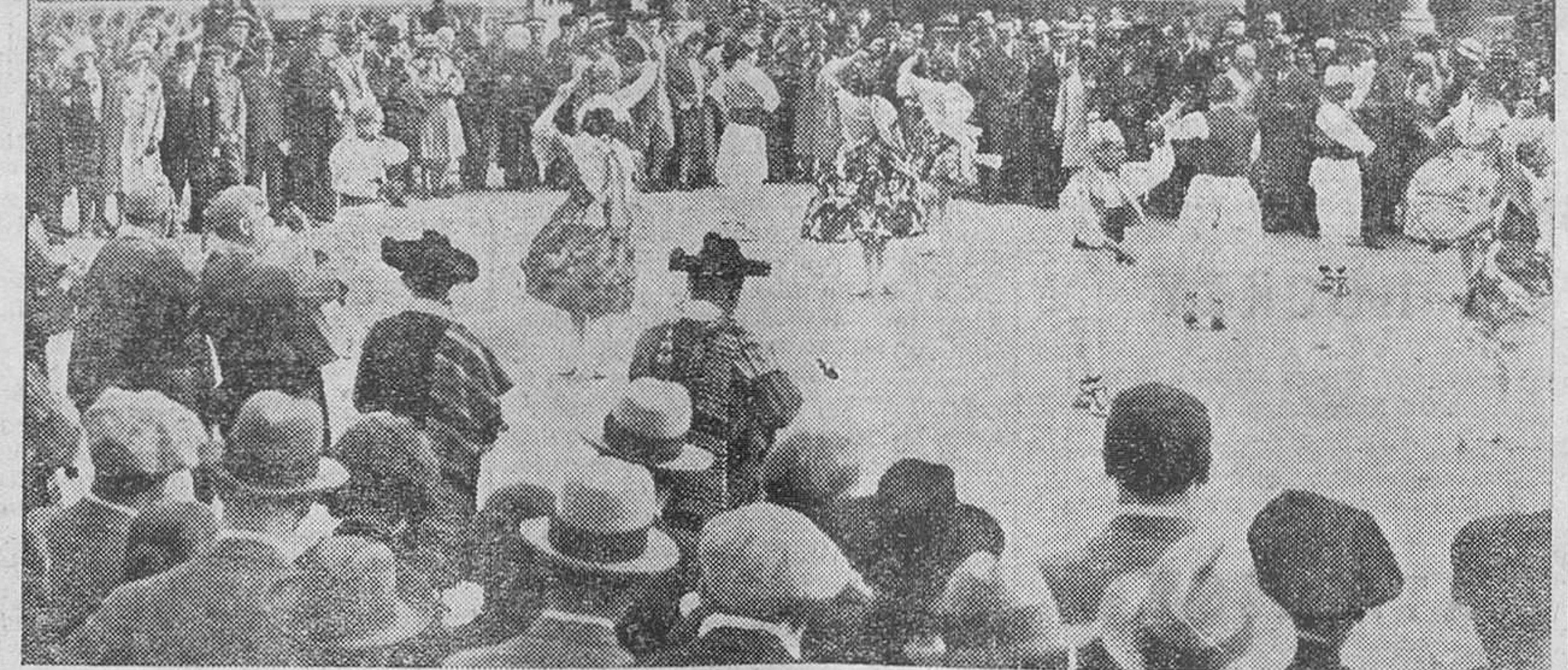
Los médicos extranjeros que nos visitaron fueron festejados ayer en los Vicerios con notas típicas

Encontraron en España por Barcelona y siguieron a Palma de Mallorca, Alicante, Málaga, Sevilla y Valencia.