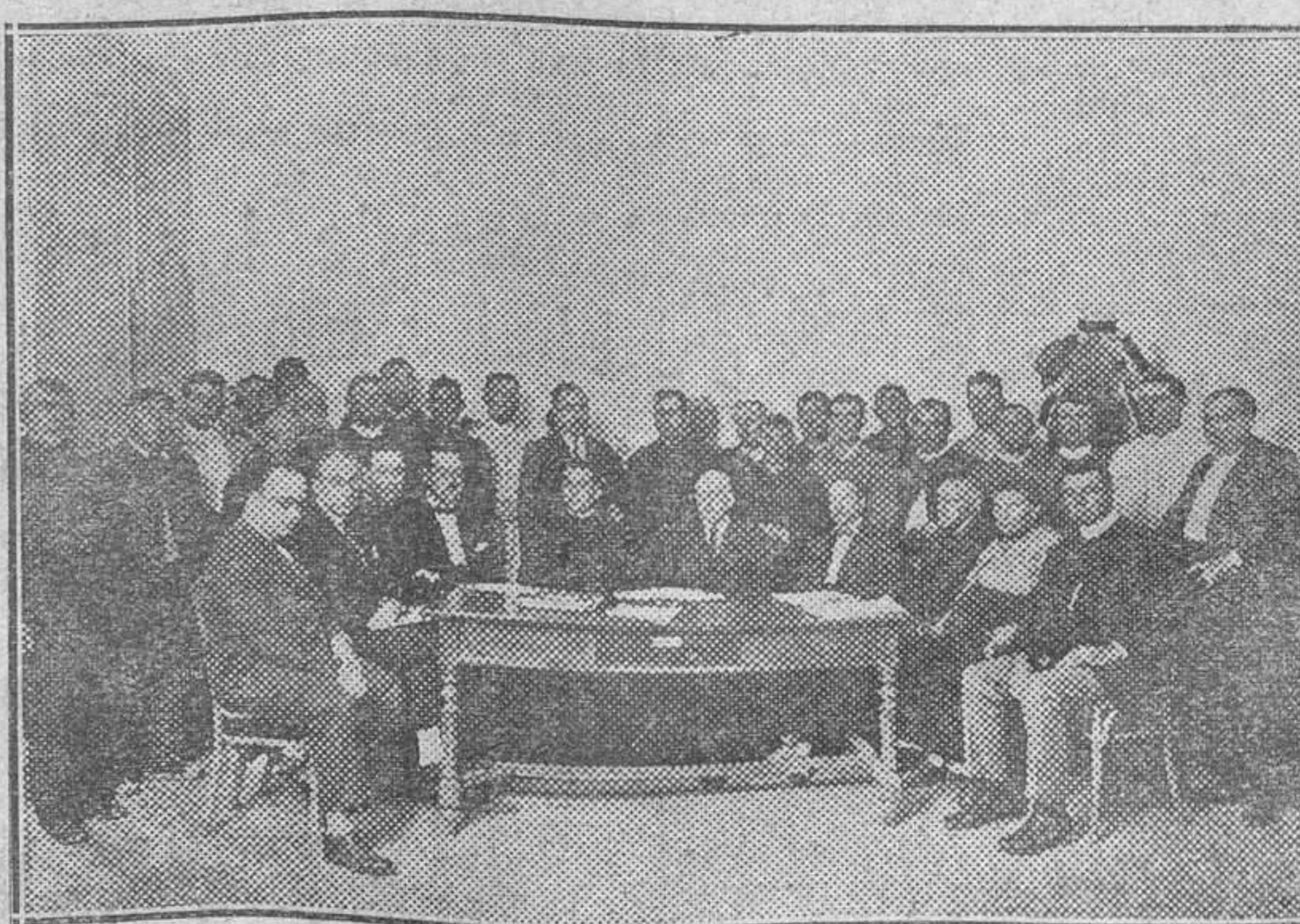
Firma de la escritura de adquisición de «El Recatón», hecha por la Caja de Previsión Social del Reino de Valencia, para su parcelamiento entre los socios del Sindicato Agrícola del Palmar, los cuales, en virtud de ello, pasarán a ser sus propietarios