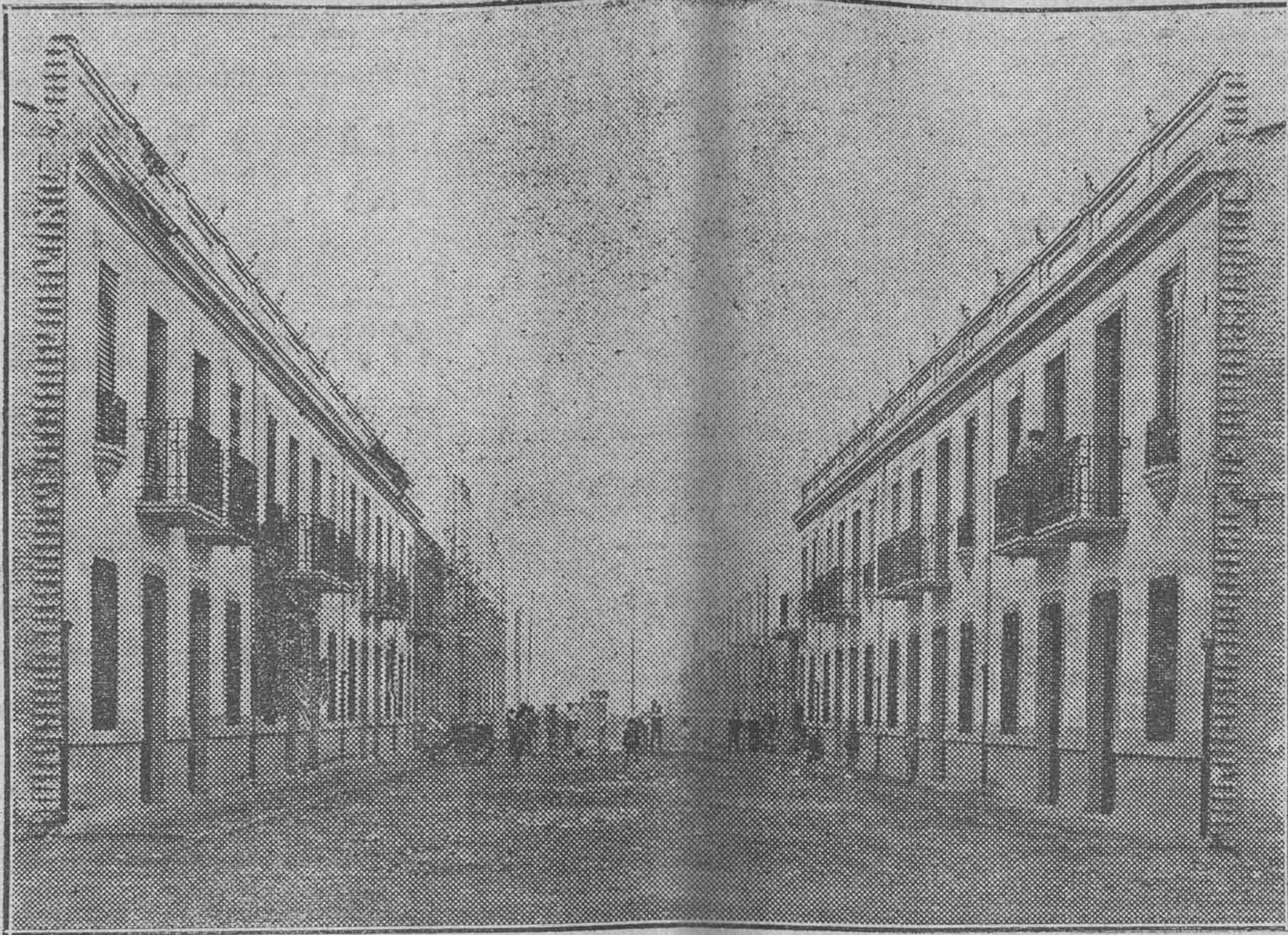
El problema de la vivienda. Barriada de «Dom Bosco», construida mediante el auxilio económico de la Caja de Previsión Social del Reino de Valencia, y que esta mañana será bendecida por nuestro Prelado