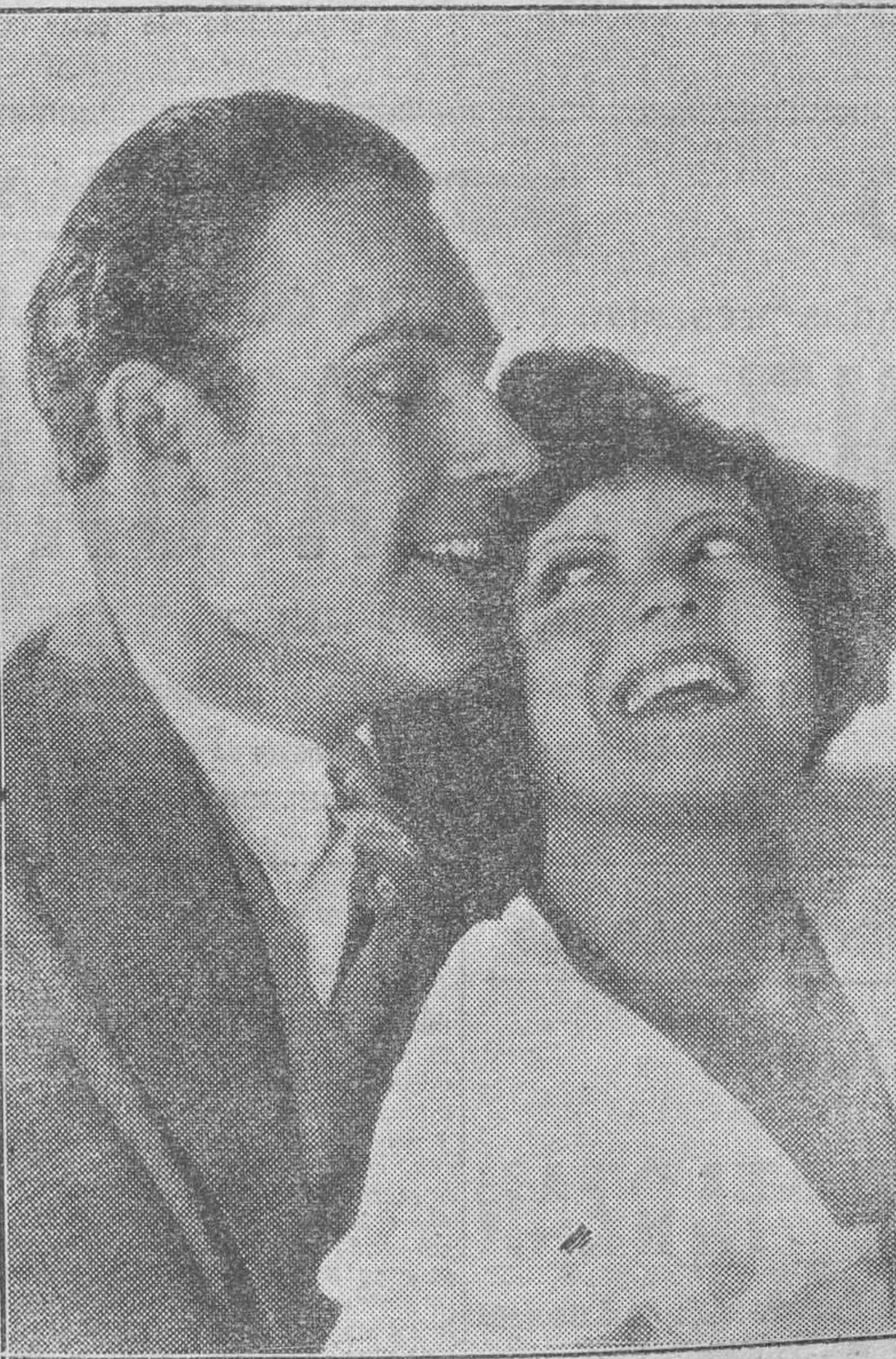
La popular «girl» de la pantalla, Clara Bow y el galán Lane Chandler, en una escena de la deliciosa comedia Paramount, titulada PELIRROJA