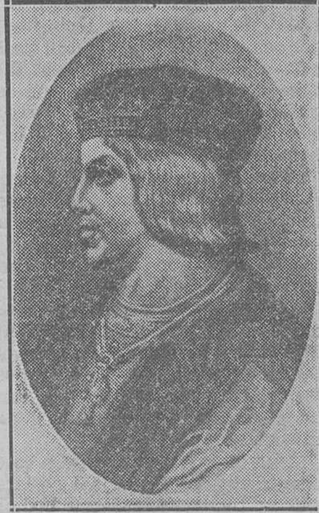
Don Fernando V. de Aragón

El 6 de Octubre quisieron amotinarse los tripulantes de la Santa María, creyéndose irremisiblemente perdidos. Colón, algo impresionado, en el deber de consultar el caso con los demás capitanes, mandó disparar un tiro de bombardera. A esta señal, las tres naves se pusieron a corta distancia, de tal manera, que pudieron entenderse unos y otros, y el almirante dijo: