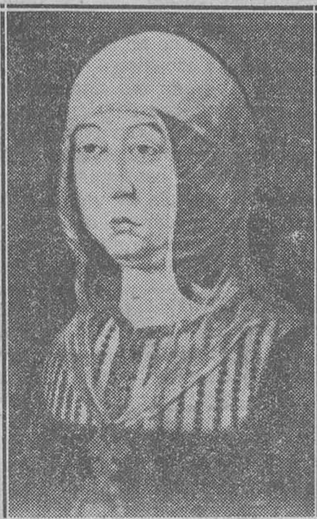
Doña Isabel I. de Castilla

Bajo la inquietud del presente se ocultan la grandeza del pasado y las esperanzas del porvenir. Tengamos fe en nuestros propios destinos. Y mientras repican las cam-