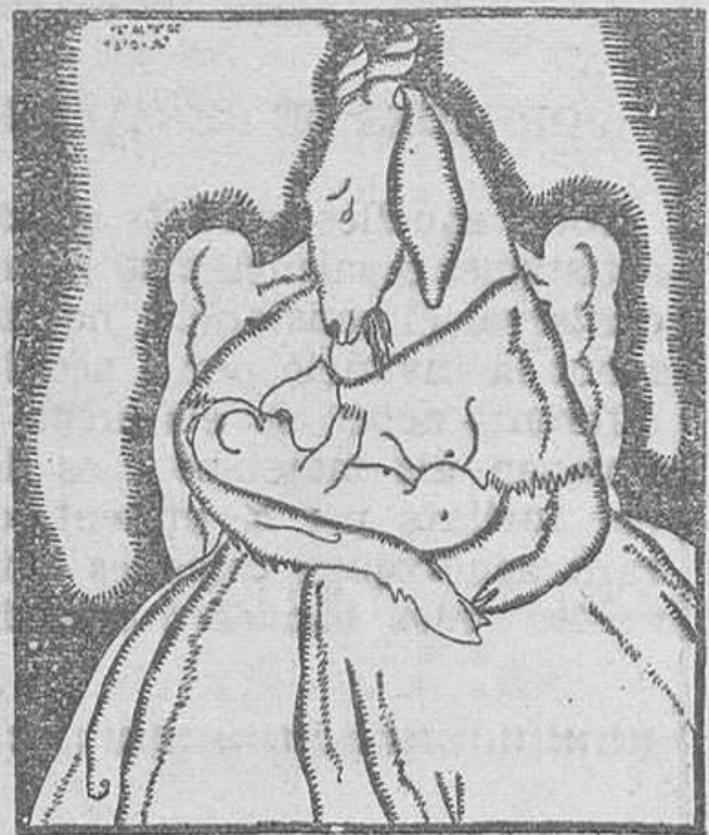
El osito más pequeño, le estaba chupando al ama: una cabrita mocha...

—Pues ya sabe en lo que consiste la receta: que sí a todo o, por lo menos—se lo permito—, calla y afirma con la testa. ¿Entendidos, verdad?