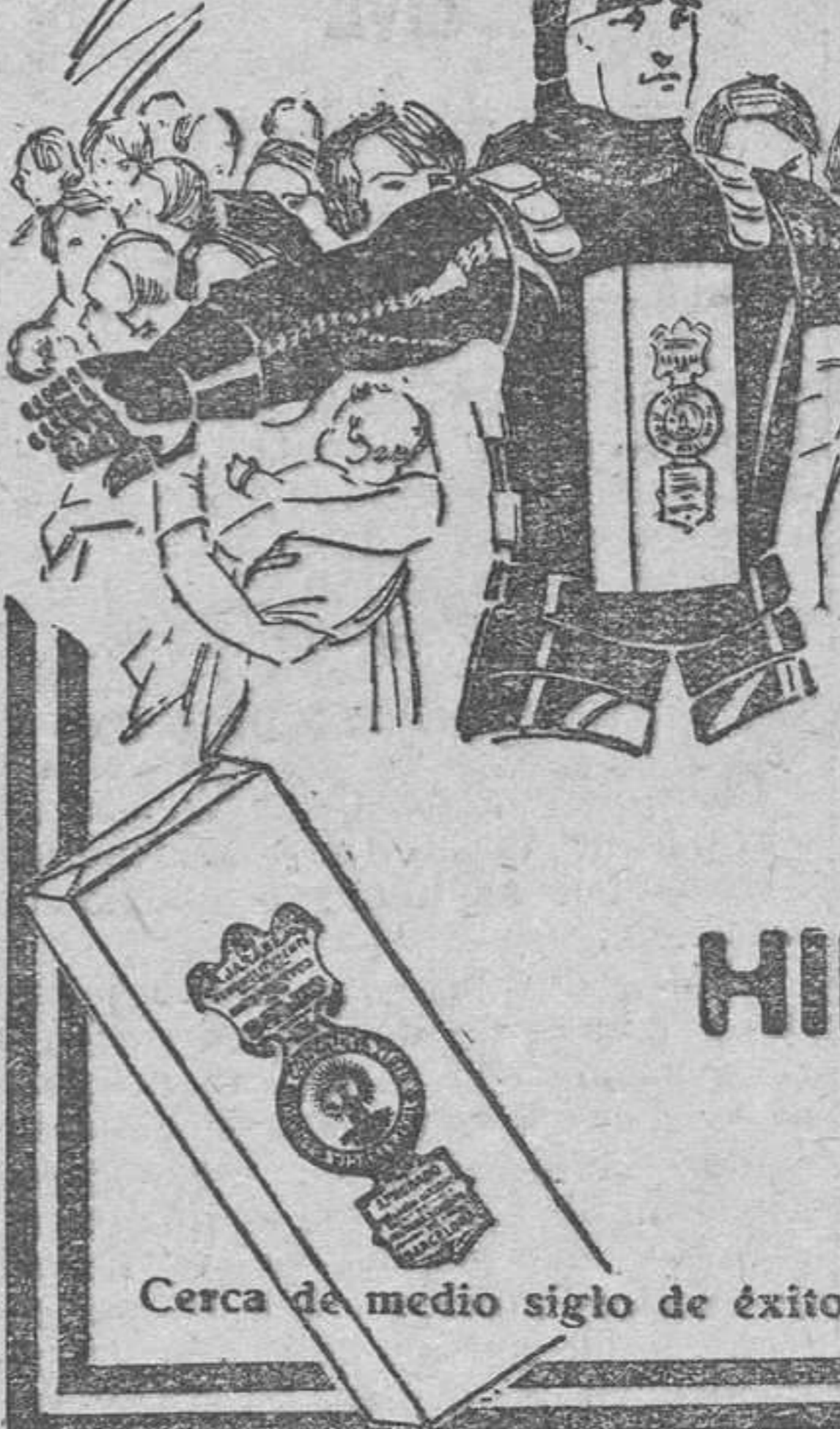
Cerca de medio siglo de éxito creciente. Aprobado por la Real Academia de Medicina.